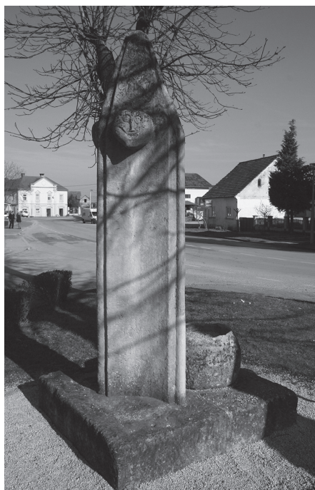
Sl. 10. Pranger – stup srama i kamena mjera