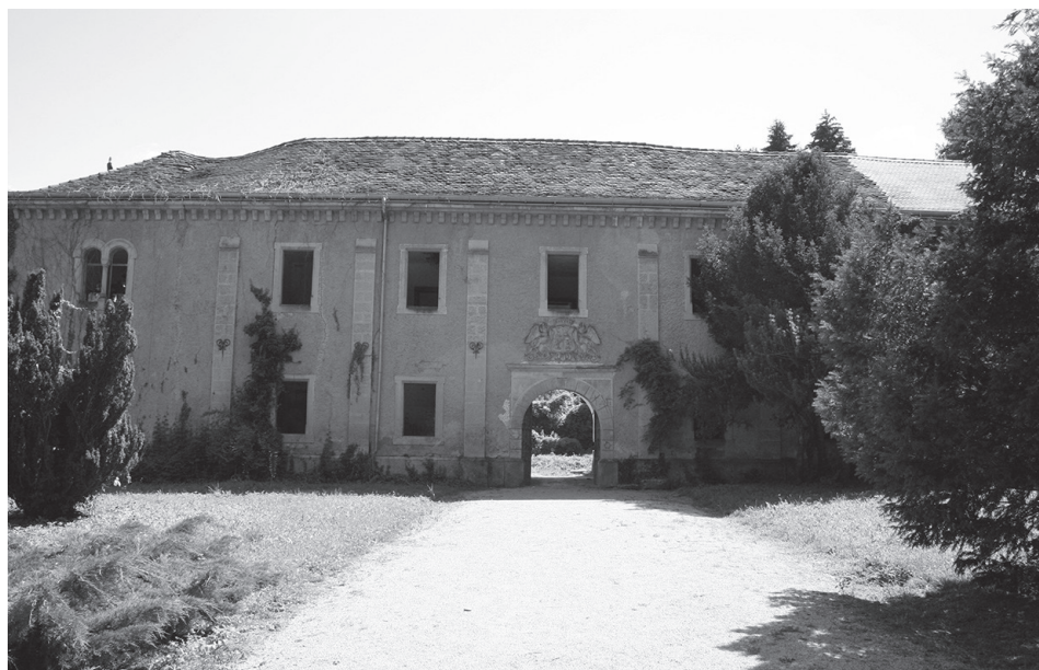
Sl. 3. Dvorac Opeka

Kurija Köröskeny-Rupčić, zvana još i posjed Vinica Donja, sljedeća je značajna građevina na području Općine Vinica. Prema kuriji vodi put, nekad aleja kestenova. Originalno je bila građena u obliku slova L u razdoblju 17./18. stoljeća te je kasnije dogradnjom još dva krila tijekom 19. i 20. stoljeća pretvorena u četverokrilni dvorac s unutrašnjim dvorištem. 6 Posjed je nekada pripadao plemićkoj obitelji Köröskeny, zatim obitelji Peschke, dok u posjed obitelji Rupčić dolazi početkom 20. stoljeća.