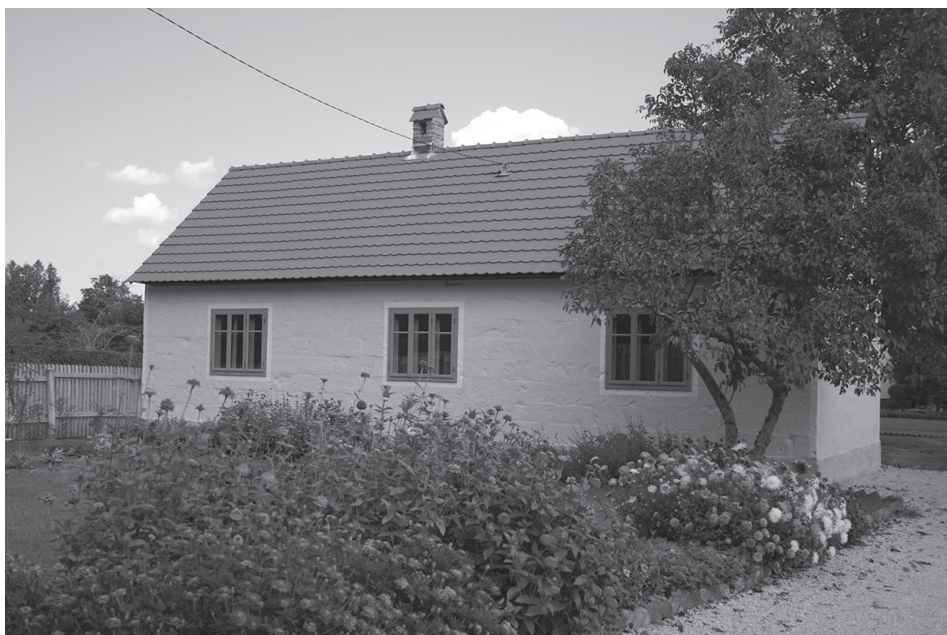
Sl. 7. Tradicijska vinička kuća poslije obnove