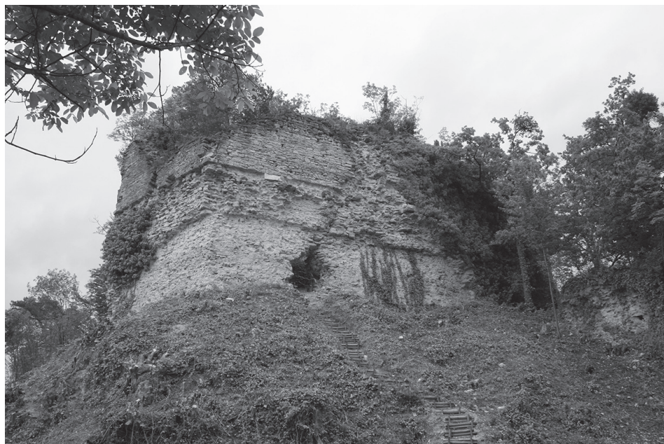
Sl. 1. Utvrda Vinica

Posebno je značajna utvrda Vinica zvana još i Stari grad ( Sl. 1 ). Utvrda se nalazi na vrhu brežuljka na mjestu koje ima odličan pregled nad velikim područjem dravske nizine u smjeru Varaždina. Uz utvrdu se vežu razne legende među lokalnim stanovništvom, od kojih je najraširenija ona da ispod nje spava velika zmija. Utvrda se spominje prvi put 1353. godine kao castrum Vinica . Krajem 14. stoljeća spominje se kao vlasnik kralj Sigismund koji je zalaže palatinu Stjepanu Lackoviću. Već 1397. godine utvrda dolazi u posjed grofova Celjskih. 4 Poslije toga, često je mijenjala vlasnike te je tijekom vremena bila nadograđivana. Značajno je da su vlasnici bili redom iz kraljevskih ili grofovskih, uglavnom visoko pozicioniranih i utjecajnih obitelji. Utvrda je s krajem srednjovjekovnog razdoblja izgubila na strateškoj važnosti i napušta se, te već u 17. stoljeću postoji zapis da je ruševna. Činjenica da je vinička utvrda kroz određeno razdoblje bila kraljevski posjed govori o njenom značaju i prava je šteta da nije ostala u cijelosti očuvana do današnjeg dana, poput, primjerice, dvorca Veliki Tabor s kojim je često uspoređuju.