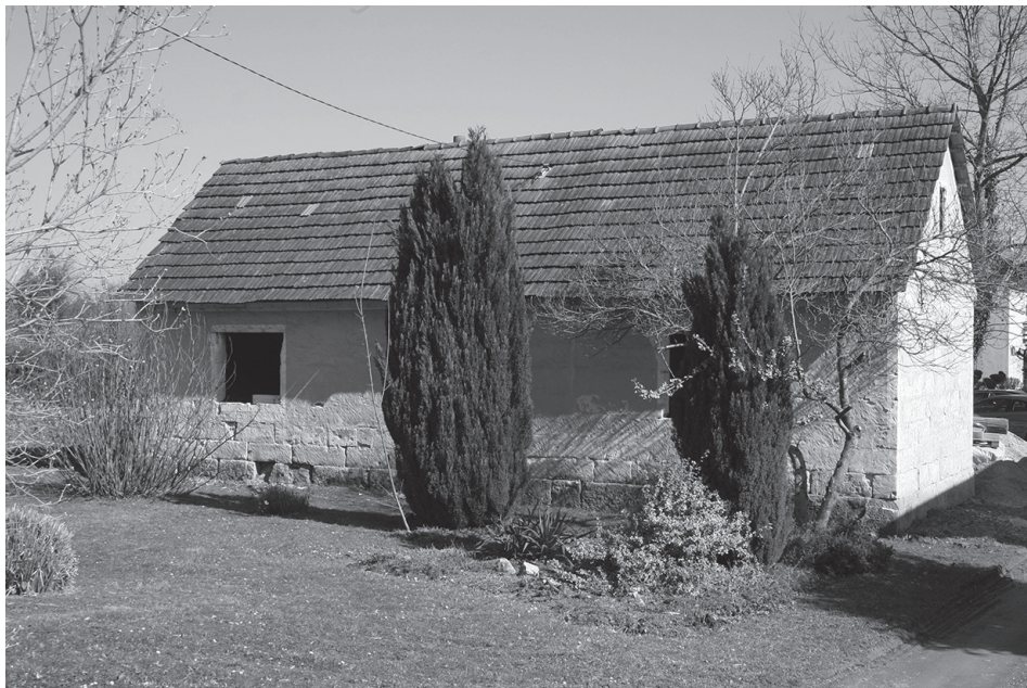
Sl. 6. Tradicijska vinička kuća prije obnove