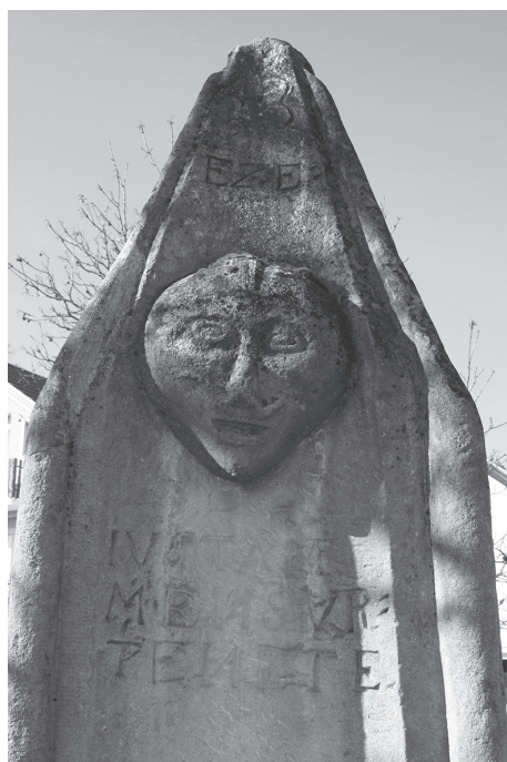
Sl. 11. Pranger – središnja glava i uklesan natpis

vištima te ponekad u dvorcima velikaša. Gradski sudac koji se u Vinici zvao judex , osudio je prestupnika te se on kažnjavao vezivanjem za sramotni stup. Tako su kažnjavani lopovi ali i svi koji su se ponašali u neskladu sa moralom. 9 Kažnjenici su obično bili vezani uz sramotni stup od jutra do večera, bez hrane i vode, gdje su ih prolaznici ismijavali, vrijeđali, gađali ih smećem i sl. Sramotni stup Pranger u Vinici jedinstven je po svom oblikovanju; to je trostrani kameni stup, visok 260 cm, koji se pri vrhu sužava u zašiljeni trokutasti završetak. Stup je usađen u široki kameni postament na kojem se nalazi i kamena posuda za mjeru. U gornjem dijelu stupa sa sve tri strane na visini od 170 cm, nalazi se po jedna glava muškarca s brkovima koja gotovo u punom profilu izlazi iz površine stupa. Ispod najveće glave uklesan je tekst na latinskom: "IVSTAM MENSVR(AM) TENETE", odnosno, 'mjerite pošteno' koji se odnosi na kamenu mjeru u podnožju, i vjerojatno je uklesan naknadno kada je ovom stupu srama pridodana kamena mjera (Sl. 11). Na području Hrvatske stupovi srama uglavnom su očuvani u priobalju (Zadar,