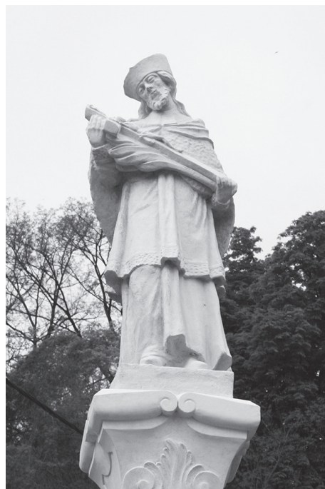
Sl. 9. Kip sv. Ivana Nepomuka poslije obnove

formi može datirati u drugu polovicu 18. stoljeće jer tada kult ovog češkog sveca doživljava kulminaciju.