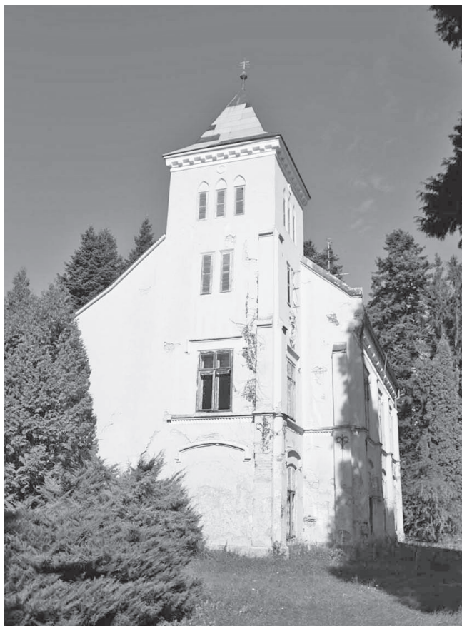
Sl. 4. Dvorac Bajnski Dvori

grof Marko Bombelles. Sa svojih putovanja donosio je različito drveće i grmlje pretvorivši tako perivoj oko dvorca u arboretum. Obitelj Bombelles živjela je u dvorcu do kraja Drugog svjetskog rata kada je dvorac nacionaliziran. Nakon rata korišten je u razne svrhe te je neko vrijeme služio i kao rezidencija Josipa Broza Tita, a nakon toga je zajedno s Arboretumom dan na korištenje Vrtlarskoj školi u Vinici. Danas je dvorac dijelom u ruševnom stanju. Zbog izuzetnih umjetničkih, dendroloških, znanstvenih, kulturno-povijesnih i drugih vrijednosti, Arboretum Opeka je od 1947. godine zaštićen kao spomenik prirode.