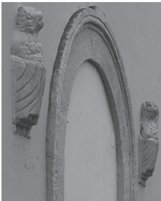
Sl. 5. Župna crkva sv. Marka, lavići na južnom pročelju

kiparskom (pretežito klasicističkom) profilu - među ostalim, uz temeljit opis propovjedaonice s velikim kamenim anđelom, kao i dvodijelne pričesne klupe (čiju gredu sa svake strane nosi šest anđela) u crkvi sv. Marka u Vinici – objavila je dr. sc. Doris Baričević ( Slovenski kipar Matija Gallo u Hrvatskoj . 2015. Časopis Kaj, XLVIII, br. 5-6, str. 45-79), zaključivši: “Upravo tim djelima crkva u Vinici mogla je zahvaliti svoje klasicističko obilježje.”