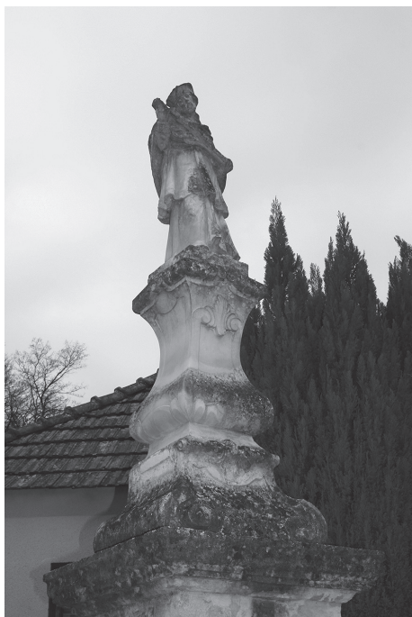
Sl. 8. Kip sv. Ivana Nepomuka prije obnove