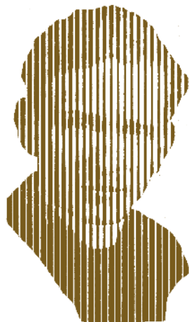
Sl. 9 Crtež don Kosta Selaka , autora Stane Kosmača (Žiri, prosinac 2017.)

studijskih godina (1912.-1917.), najprije u Dubrovniku, a onda na ovim lokacijama kao župnik: kratko vrijeme (1917.-1918.) u Gradežu/Gradu u Italiji; zatim (1918.-1919.) na Trati kod Gorenjske vasi u Poljanskoj dolini (Slovenija) i poslije (1924.-1926.) opet u Hrvatskoj, u Orebiću na poluotoku Pelješcu; između godine 1926. i 1927. bio je Selak u Cavtatu, a u godinama 1927.-1932. ustalio se u Kuni; tri mjeseca boravio je i radio u Aleksandrovu (Punat na otoku Krku, 1932.); nakon toga otišao je u Blato na Korčuli, opet „samo“ tri mjeseca, a onda najduže, 27 godina (1933.-1960.), ostaje u Janjini na Pelješcu. Tu se don Kosto Selak presvukao te je, napustivši franjevački red, imenovanjem dubrovačkog biskupa 1933. postao biskupijskim svećenikom. Ovo su samo okviri u kojima je „blaga“ (umjetnička) duša sve vrijeme gorjela za umjetnost i ljepotu, najviše za glazbu. Ovdje ga posebno ističemo kao autora i izdavača 14 HIMENA (1954.) i 6-stavčne Misse in S. Blassi/Mise sv. Vlaha (patrona, zapravo zaštitnika i sveca dubrovačkog, pod čijom crkvenom jurisdikcijom je don Kosto Selak najduže djelovao; 1958.). O don Selaku još uvijek nismo izrekli sve. Iako nije imao nikakve prave stručne (profesionalne skladateljske) glazbene naobrazbe, a još manje