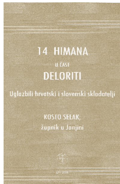
Sl. 10 Naslovna stranica 14 HIMANA (Split, 2018.)