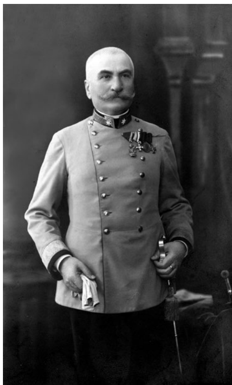
Slika 2. Portret Nikole pl. Ištvanovića u činu general pukovnika.