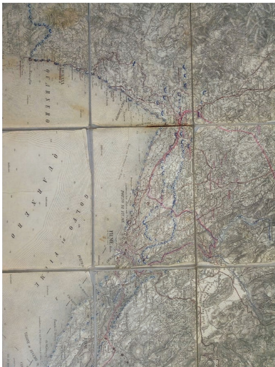
Slika 5. Isječak karte Rijeke i okolice borbenim položajima koje je osobno rukom ucrtao Nikola pl. Ištvanović.