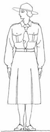
Женски летњи крој