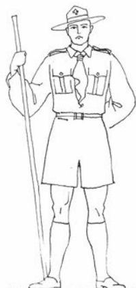
Мушки летњи крој