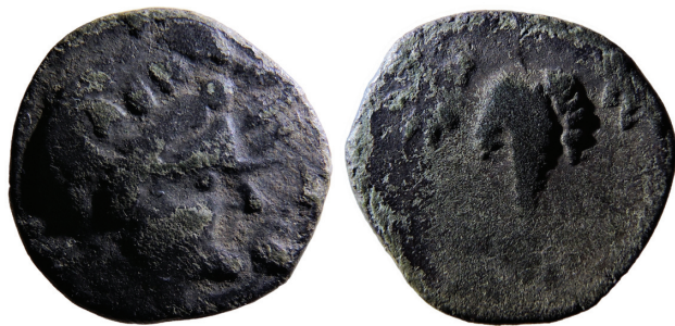
Sl. 5. Fig. 5.

su na južnoliburnskim gradinama, i to na Bribiru 17 i Trojanu. 18 No čini se da to nije sve. Jedan je izložen u stalnom postavu zadarskog Arheološkog muzeja. Taj komad (17,5 mm, 4,037 g, 3 h) vjerojatno potječe s nekog nalazišta u sjevernoj Dalmaciji.