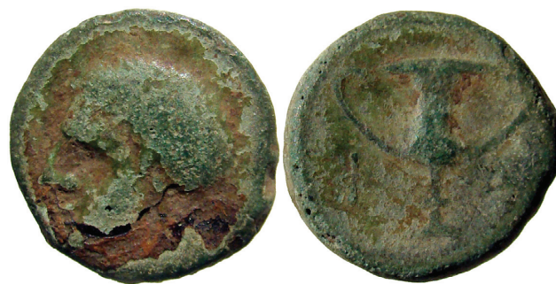
Sl. 2. Fig. 2.

U numizmatičkoj zbirci Arheološkog muzeja u Zagrebu čuva se farski novac tipa glava / kantar, pod inventarnim brojem 2564 (sl. 1). Podrijetlom je s medačkog područja, oko 15 km jugoistočno od Gospića. 8 Vjerojatno je nađen na japodskoj gradini pod imenom Medak, a ne na širem podnožju, gdje se rasprostire istoimeno mjesto. Na aversu je prikaz ulijevo okrenute muške glave, koja je, čini se, ovjenčana. U središtu reversa je kantar, a s donje lijeve i desne strane te posude s dvije ručke je kratica \Phi -A. Farski novac istog tipa, promjera 18 mm i težine 2,98 g, potječe i s Gackoga polja (sl. 2). Nađen je negdje na području Prozora kod Otočca. 9 Okolnosti nalaza nisu poznate. Možda je otkriven na Vitalu, japodskoj gradini s jugoistočne strane Prozora. 10 Ovakav farski novac tipa muška glava / kantar Visonà datira u kasno 3. – rano 2. st. pr. Kr. (?). 11 Bio je u optjecaju i kod Liburna,