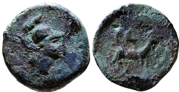
Sl. 3. Fig. 3.

japodskih južnih susjeda. Najbliži analogni primjerak potječe s Beretinove gradine kod Radovina. 12