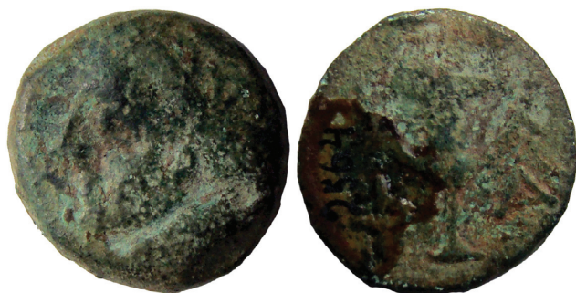
Sl. 1. Fig. 1.

Dalmacije (karta). 7 Svi su iskovani od bakrene slitine. Uglavnom su u dobrom stanju očuvanosti, s izvornom patinom i ponešto naslaga nečistoće.