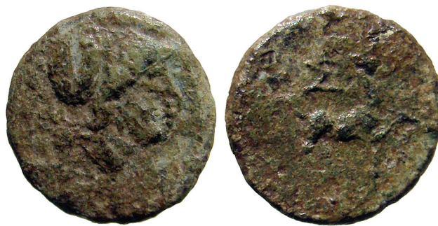
Sl. 4. Fig. 4.

coins of the same type have been dated by Visonà to the late 3 rd /early 2 nd century BC (?). 11 It was also in circulation among the Liburnians, the neighbours of the Iapodes. The closest analogous example came from Beretinova gradina hillfort at Radovin. 12