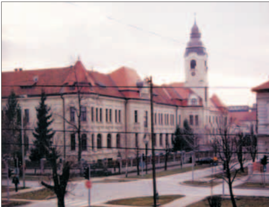
Sl. 3 Današnji izgled kompleksa