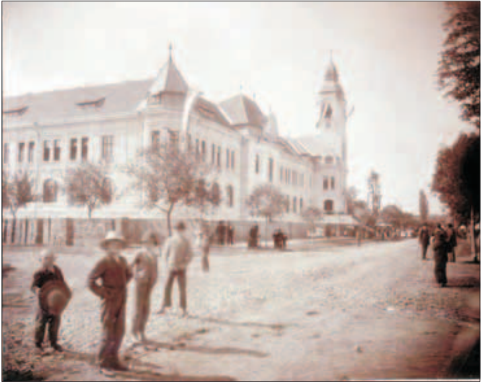
Sl. 6 Dan blagoslova 14.9.1908.