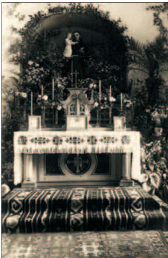
Sl. 7 Stari oltar sv. Antuna

24. na 25. ožujka svake godine obavlja se klanjanje u znak zahvalnosti što je u teškom potresu 1884. godine samostan ostao pošteđen, iako je bio dosta oštećen, ali nije nitko stradao. Godišnje klanjanje obavlja se na 1. dan svibnja, a u nedjelju iza blagdana Srca Isusova, također je javna pobožnost klanjanja u znak zahvale i zadovoljštine. U svim ovim i drugim pobožnostima uzima udjela sve više vjernika, ne samo iz Đakova, nego i iz okolice. Pred oltarom Presvetoga Srca Isusova sve sestre polažu svoje prve i doživotne zavjete. U crkvi se zajednica sastaje na propisane zajedničke molitve. Svodovi ove crkve kriju bezbroj molitvenih pohoda prijašnjih i sadašnjih sestara sv. Križa koje zastupaju i pred Boga iznose sve brige i potrebe svojih sugrađana i svih potrebnika i svojom sestriškom skrbi obuhvaćaju sav svijet.