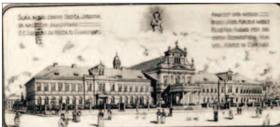
Sl. 2 Prijedlog crkve (bez tornja) od istog autora