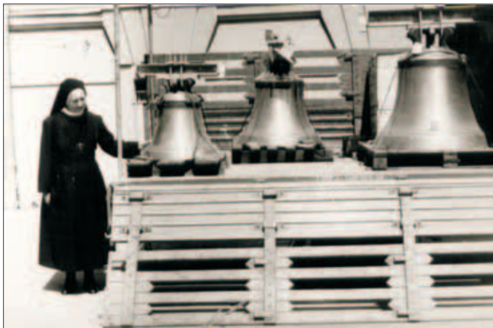
Sl. 5 Nova zvona postavljena 1979.

crkvi sv. Ivana Krstitelja u selu Pisak pokraj Đakova, 19. lipnja 1979. godine. 26 Sadašnja zvona nabavljena su pri obnovi crkve 1979. godine. Izlivena su u radionici Glockengiesserei Gebrüder Bachert, Bad Friedrichhall-Kochendorf, Njemačka. Bilo ih je vrlo teško dobiti u Hrvatsku. Na carinarnici u Osijeku bilo je velikih teškoća i skoro su bila vraćena natrag. Nakon više intervencija s raznih strana stigla su sasvim tiho u Đakovo 8. lipnja 1979. i sutradan popodne u 14,30 sati podignuta u toranj. Blagoslovio ih je najprije preuzvišeni biskup Ćiril Kos, a kad je počelo dizanje prvog zvona spustila se jaka kiša uz sijevanje i grmljavinu. Tjednima prije toga nije bilo kiše i ovo je bio kao znak s neba. Kad je treće zvono smješteno na mjesto istog se časa nebo razvedrilo. Neki prolaznici promatrajući dizanje zvona govorili su: «Ovo je za pamćenje!». Prvo zvono ima ton «B» i teško je 400 kg, promjera 90 cm, a nosi natpis «Presveto Srce Isusovo, uzdam se u te!». Drugo zvono ton «DES» 220 kg, promjer 73 cm s natpisom Prečisto Srce Marijino, budi naše spasenje!». Treće zvono ton «F», 120 kg, promjer 59 cm s natpisom «Sveti Josipe, moli za nas!» Otada ova zvona prate preminule sestre na