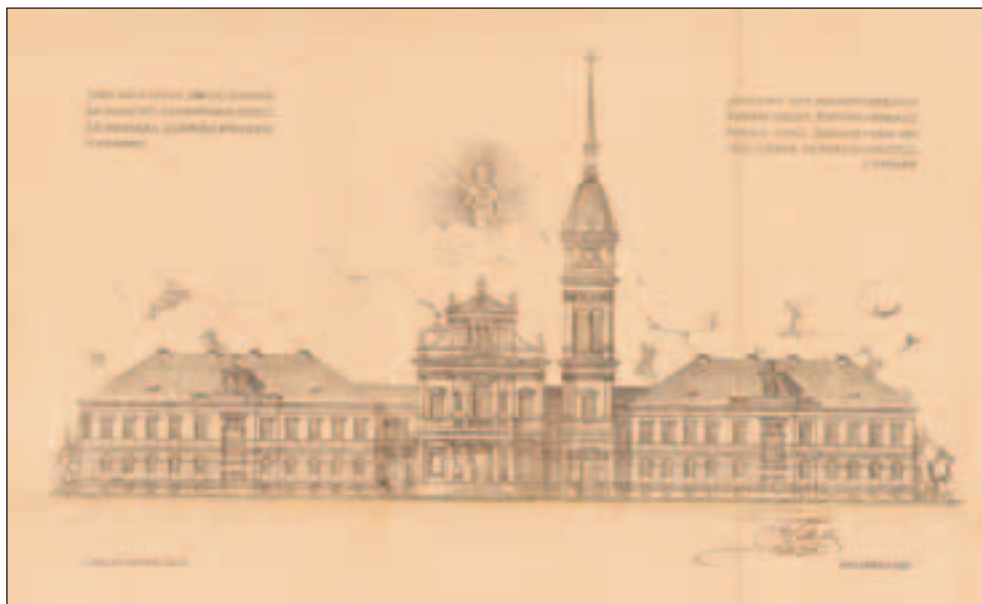
Sl. 1 Prvi nacrt Flohr-a 1902.