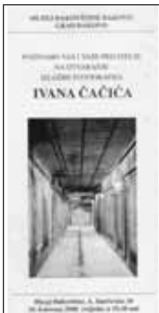
Borislav Bijelić: Izložba fotografija Ivana Čačića