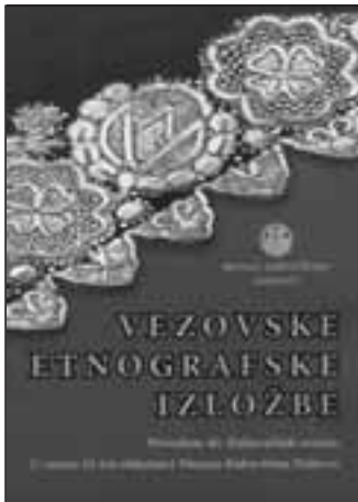
Branka Uzelac: Vezovske etnografske izložbe