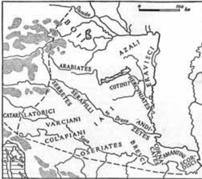
Storosjedilačko stanovništvo Panonije