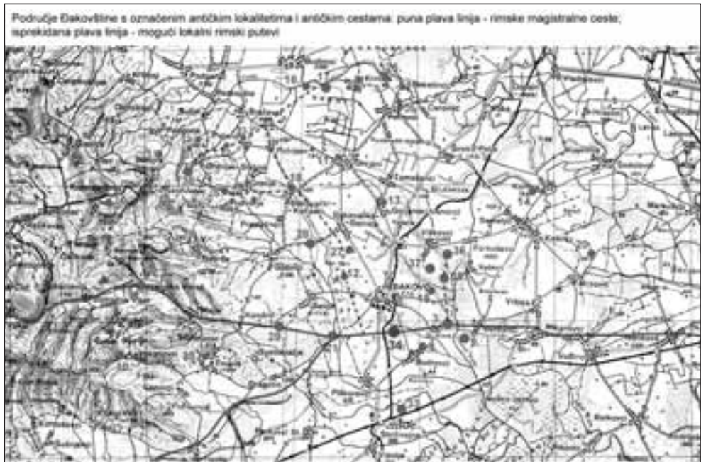
Karta antičkih lokaliteta u Đakovštini