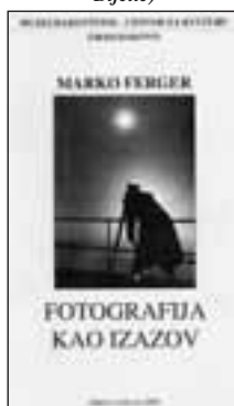
Katalog izložbe fotografija Marka Fergera (Borislav Bijelić)