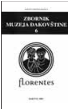
Zbornik Muzeja Đakovštine 6