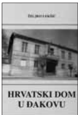
Željko Lekšić: Hrvatski dom u Đakovu