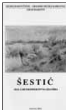
Katalog izložbe Mala retrospektivna izložbe Ljudevita Šestića (Borislav Bijelić)