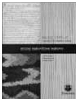
Katalog izložbe Milko Cepelić – u povodu 150. obljetnice života (Branka Uzelac)