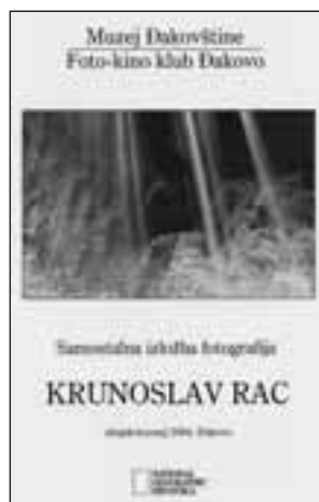
10.1 Katalog izložbe Krunoslava Raca (Borislav Bijelić)