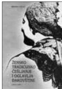
Katalog "Žensko tradicijsko češljanje i oglavlja Đakovštine" (Branka Uzelac)