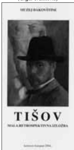
Katalog izložbe Ivana Tišova (Borislav Bijelić)