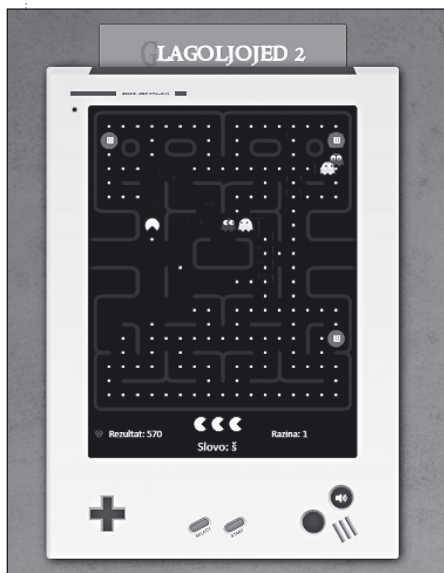
2. slika: Glagoljojed 2 je igra tipa Pac-Man u kojoj se s pomoću pojedenoga glagoljičnog slova može pojesti duhove ( https://jezicneigre.com/hr//glagoljojed2/ ).

na dnu zaslona piše odgovarajuće latinično slovo. Glagoljostrelka je inspirirana popularnom arkadnom igrom Space Invaders . Budući da već postoji igra Svemirska glagoljica , promijenjen je izgled igre tako da za razliku od igre Space Invaders ta igra izgleda kao da se odvija u srednjemu vijeku. Igrač ne pokreće svemirski brod kao u izvornoj igri, nego luk iz kojega se strijelama ne gađaju izvanzemaljci, nego glagoljična slova. Kao podloga za igru postavljen je stari srednjovjekovni papir umjesto svemira te se u pozadini nalazi slika srednjovjekovne borbe s Osmanlijama. Obje nove igre imaju zvučne efekte koji prate određene događaje u igri.