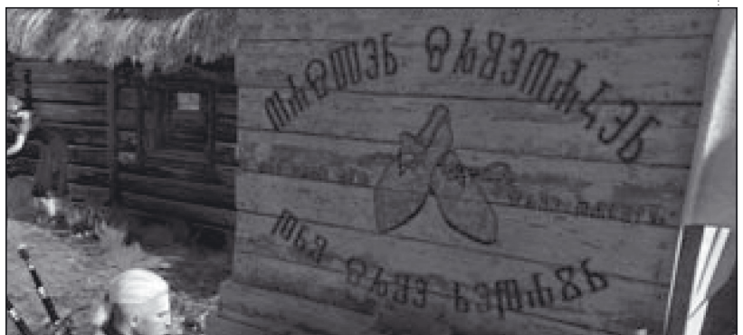
4. slika: Glagoljica ispred postolarskoga obrta u igri Witcher 3

I na kraju spomenimo još da je osim u spomenutim obrazovnim igrama glagoljica prisutna i u nekim velikim komercijalnim igrama. U poljskim igrama iz serijala Witcher glagoljica se može vidjeti povremeno na pločama, plakatima te oružju i oruđu. U hrvatskoj igri Serious Sam 3 glagoljica se upotrebljava kao pismo izvanzemaljaca koji napadaju zemlju. Više o glagoljici u komercijalnim igrama možete pročitati u članku Glagoljica u komercijalnim videoigrama u časopisu Baščina 18. U budućnosti možemo očekivati još igara te drugih zabavnih multimedijских sadržaja s glagoljicom s obzirom na dostupne informatičke resurse i algoritme koji se mogu na mnoge kreativne načine iskoristiti da pouče korisnike o različitim zanimljivim činjenicama i znanjima vezanim uz glagoljicu.