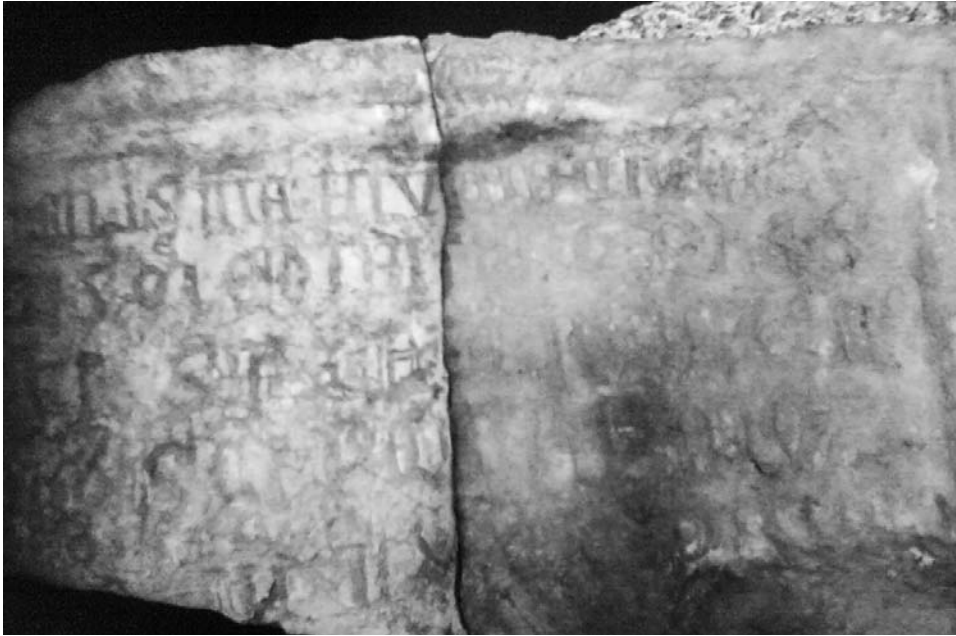
Sl. 1. Fragment epigrafa (13. – 14. v.), koji se vjerovatno odnosi na crkvu sv. Petra

Da je crkva okupljala duhovnike iz istaknutih barskih porodica i sticala posjede u gradskom distriktu, svjedoči i testamentarna odredba iz 15. stoljeća. Barski kanonik i mljetski benediktinski opat Andrea de Zare u oporuci iz 1421. godine kanonicima »di Sancto Piero d'Antivari« zaviještao je jedan teren u planini ( montagna ), koji graniči »con Gradina, chiamato Grisas«, jedno polje u Bualu i masline »de Congera« 20 te zemljište s pripadnostima, s tim da mole Boga »per li nostri morti«. 21