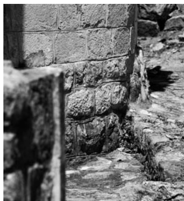
Sl. 2. i 3. Stari grad Bar: rozeta i donji dio apside crkve sv. Jovana Krstitelja