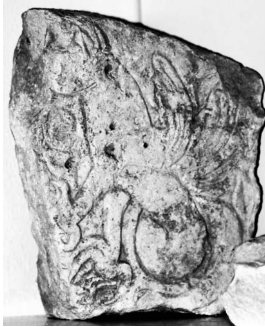
Sl. 4. Fragment reljefa s prikazom fantastičnog stvorenja (13. – 14. st.) (foto: H. Stieber)

Fragment plitkog reljefa, pronađen, kako se na drugom mjestu navodi, 1960. godine, u objektu 111 (neposredno uz unutrašnja gradska vrata), koji je moguće prvobitno pripadao objektu 106, groteskni je prikaz legendarne zvijeri, himere, odnosno vodorige (fr. gargouille ). 76 Sv. Bernard iz Clairvauxa (12. st.) govorio je protiv takve mitske predstave zla. Najčešće se, kao skulpture, nalaze na krovovima crkava. Izrezbareni prikaz tog fantastičnog stvorenja (13. – 14. st.) možda se nalazio na dovratniku crkvenih vrata. 77