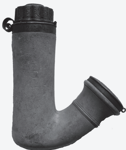
4. Lula Beč, 1840. stiva; srebro 14,5 x 12,8 cm; promjer 4,4 cm signatura: punca za Beč 1840. godine (na poklopcu), majstorska punca IN (ili NI) MSO-218807 KOMZA, 1946.

Cilindrična, visoka glava lule bez ukrasa, ravnog dna. Na vratu lule višestruko profiliran prsten, srebrni jednostavan okov s malom karikom za sigurnosnu vrpku. Srebrni poklopac valovitog presjeka bogato ukrašen reljefno oblikovanim stiliziranim biljnim motivom.