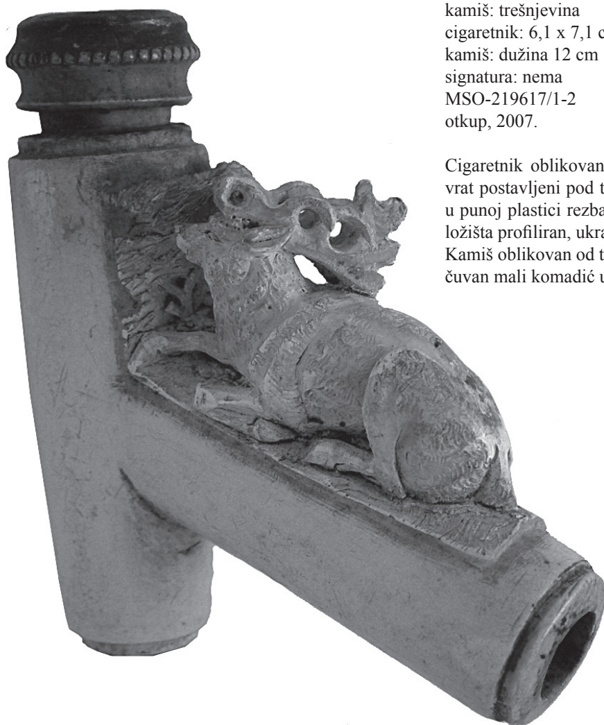
31. Cigaretnik s kamišem Beč (?), 19. stoljeće cigaretnik: stiva, rezbarenje kamiš: trešnjevina cigaretnik: 6,1 x 7,1 cm, promjer 1,8 cm kamiš: dužina 12 cm signatura: nema MSO-219617/1-2 otkup, 2007.

Cigaretnik oblikovan poput male lule u kojoj su glava i vrat postavljeni pod tupim kutem. Na vrhu vrata apliciran u punoj plastici rezbareni jelen koji počiva uz tarabu. Vrh ložišta profiliran, ukrašen vijencem sitnih zrnaca. Kamiš oblikovan od tokarenog trešnjinog drva, na vrhu sačuvan mali komadić usnika od kosti.