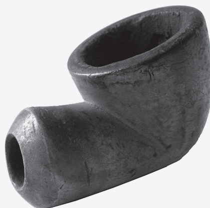
9. Lula radionica J. Hitschman, Beč, druga polovica 19. stoljeća stiva; srebrna legura 6,7 x 5,3 cm; promjer 2,4 cm signatura: oznaka majstora rezbara J. HITSCHMAN utisnuta na obod vrata lule; majstorska punca za srebro J H (N) S (u geometrijskoj mreži) na okovu glave lule MSO-218868 otkup, 1964.

Glava lule kupolastog oblika, sužava se prema dnu; kratak jednostavan vrat. Bez ukrasa. Tipološki srodna luli MSO-218810.