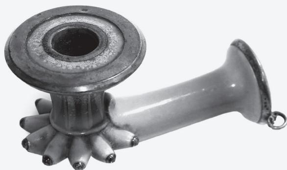
27. Cigaretnik u obliku turske lule druga polovica 19. stoljeća stiva, rezbarenje; mjedena legura, tiještenje 3,5 x 6,3 cm signatura: na okovu glave utisnuto M MSO-219294 nabava nije utvrđena

Cigaretnik u obliku male turske lule. Glava je konična, prema vrhu se širi, a u dnu obrađena poput vijenca kružnih latica s mjedenom kuglicom na vrhu svake. Dugačak vrat cigaretnika postavljen pod pravim kutem. Jednostavni mjedeni okov na vrhu glave cigaretnika te vrhu vrata, gdje je i mala karika za sigurnosnu vrpču. Na dnu vrata aplicirana mjedena traka.