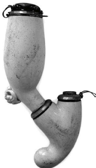
11. Glava lule s usadnikom Beč (?), 19. stoljeće stiva; mjed, tiještenje 18 x 9 cm; promjer 3,5 cm; usadnik: visina 9,4 cm signatura: nema MSO-218811(1-2) KOMZA, 1946.

Dvodijelna lula, sastavljena od glave lule i usadnika-kondenzatora. Peta glave oblikovana poput cvjetnog buketa; usadnik u obliku slova Y sa zaobljenim dnom. Okovi poligonalni, poklopac ukrašen cvjetnim girlandama. Sačuvan komadić izvorne sigurnosne vrpce.