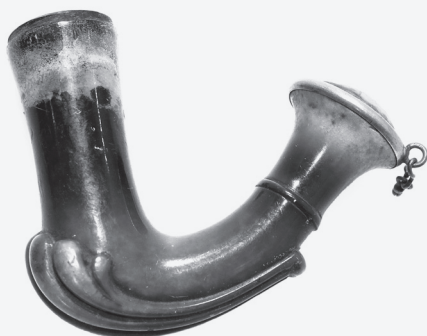
29. Cigaretnik Njemačka (?), 19. stoljeće stiva, rezbarenje; mjedena legura, tiještenje 5,8 x 7,4 cm, promjer 2 cm signatura: nema MSO-219295 nabava nije utvrđena

Cigaretnik oblikovan poput lule koja tipološki pripada skupini lula u obliku vrata labuda. Dno rezbareno u obliku školjke. Vrat je bikonično proširen i okovan mjedanim prstenom s karičicom s koje visi komadić mjedene sigurnosne lančica.