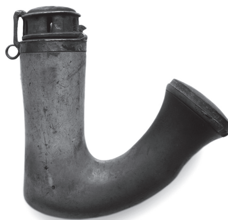
6. Lula Srednja Europa, druga polovica 19. stoljeća stiva; srebrna legura, tiještenje 8,5 x 8,5 cm; promjer 3 cm signatura: punca J H, na okovu poklopca MSO-218867 otkup, 1964.

Iz vlasništva veleposjednika Ferdinanda K. Schmidta, Osijek.