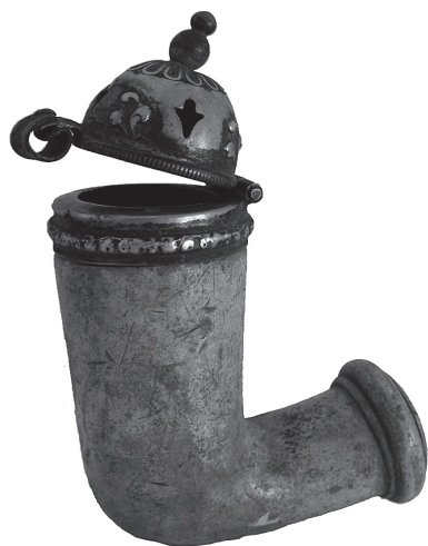
10. Lula Srednja Europa, 19. stoljeće stiva, rezbarenje; mjedena legura, tiještenje 13,1 x 10,4 cm signatura: nema MSO-219289 nabava nije utvrđena

Mala lula, kod koje su glava i vrat oblikovani pod pravim kutem. Okov samo na glavi lule, ukrašen tiještenim florealnim motivom, sa šarkom i poklopcem u obliku kupole sa šiljkom. Prorezi na poklopcu rezani poput stiliziranih ljiljana, izmjenjuju se s reljefno iskucanim ljiljanima. Uokolo šiljka, iskucana rozeta.