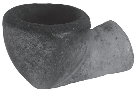
7. Lula Njemačka (?), 19. stoljeće stiva, rezbarenje 4,2 x 6,8 cm; promjer 4,3 cm signatura: nema MSO-218810 KOMZA, 1946.

Glava lule je kupolastog oblika, sužava se prema dnu, kratak jednostavan vrat. Bez ukrasa. Tipološki srodna luli MSO-219421.