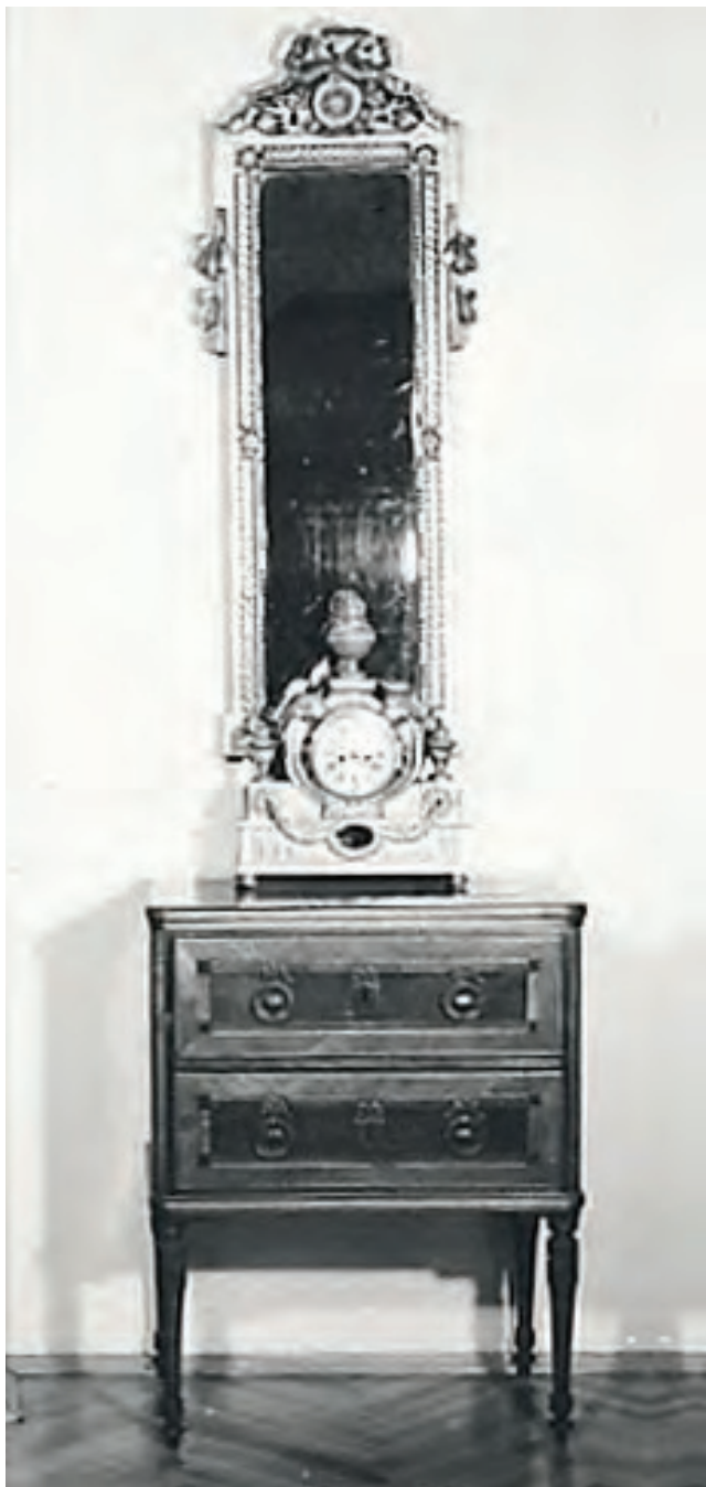
Sl. 6. Stalni postav Odjela primijenjene umjetnosti na temu: Stilski razvoj namještaja – razdoblje klasicizma (Louis XVI.): komoda, mala, Austrija (?); zrcalo, zidno, Francuska (?), kraj 18. st. (MSO-U-122, MSO-U-125), Zbirka fotografija Muzeja Slavonije

Treba spomenuti i brojne druge sitnije predmete koji će pronaći svoje mjesto u stalnom postavu nešto kasnije, kada predmeti budu stručno obrađeni i vrednovani. Staklo je bilo zastupljeno predmetima iz donacije bračnog para Irme i Ivana Govorkovića, najvećim dijelom srednjoeuropske provenijencije iz 19. i početka 20. st., koji su bili izloženi u originalnoj, također darovanoj, vitrini smještenoj u hodniku. Postav je bio upotpunjen slikama, portretima povijesnih ličnosti, mahom slavonskog plemstva, koje su ujedno predstavljale ilustraciju ambijenta i odjeće, odnosno kostima određenog razdoblja, a ne prvenstveno umjetničku