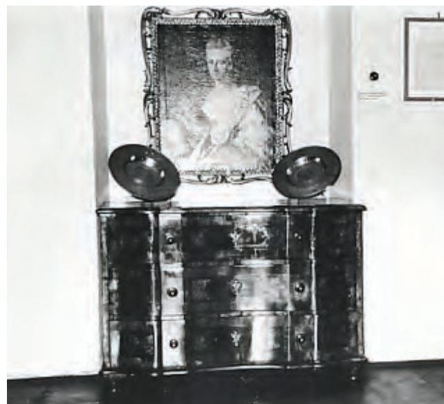
Sl. 5. Stalni postav Odjela primijenjene umjetnosti na temu: Stilski razvoj namještaja – razdoblje baroka: komoda, Austrija, sredina 18.st. (MSO-U-101); tanjuri, ukrasni, Njemačka, početak 18. st., Zbirka fotografija Muzeja Slavonije

vrijeme, čak ni veći muzeji s cjelovitijim stalnim postavom namještaja nisu imali ovakav priručnik, možemo slobodno reći – vodič kroz brojne stilske mijene i prilagodbe. Izdavač ove publikacije bio je upravo Muzej Slavonije.