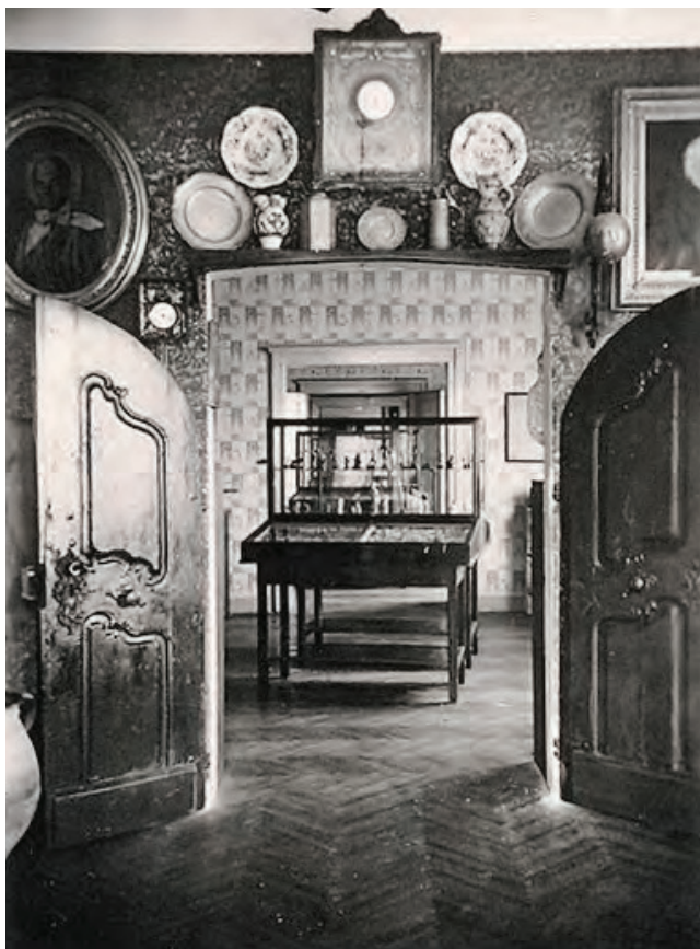
Sl. 1. Stari postav osječkog muzeja na Mažuranićevom vijencu (1933. – 1946.)