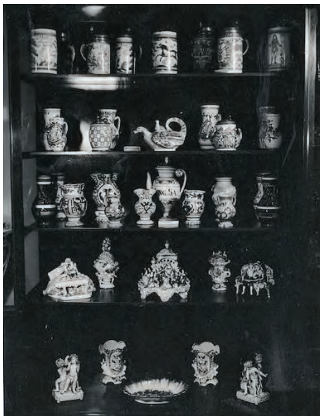
Sl. 2. Stalni postav (tematske sobe): vitrina s keramikom, foto: Nikola Szege (?), 1949. (?), Zbirka fotografija Muzeja Slavonije

Tako se već na prvim stranicama Dnevnika upoznajemo s aktivnostima vezanim uz Komisiju za prikupljanje, zaštitu i čuvanje spomenika kulture (KOMZA) koja je od 1946. do 1949. inicirala prikupljanje predmeta zatečenih u kućama i na posjedima bogatih plemićkih i građanskih obitelji u Osijeku i okolici, nakon što su njihovi vlasnici napustili zemlju uoči Drugoga svjetskog rata ili nakon njegova završetka (u Valpovu, Našicama, Vukovaru, Iloku i Tenji). Mnogi od ovih predmeta dopremljeni su u Muzej, čime su se znatno povećale dotadašnje muzejske zbirke, a posao popisivanja dopremljenih predmeta, njihova zaštita, pohrana, a zatim i stručna obrada, zahtijevali su znanje, dobru organizaciju i zajednički angažman. Navedenih aktivnosti, zahvaljujući ponajviše kvalitetama i sposobnostima te ogromnoj energiji dr. Pinterović, nije nedostajalo. Takav uznosit duh, veliki radni elan i potpunu predanost poslu prenijela je i na najbliže suradnike. Na redovitim radnim sastancima, početkom tjedna, iznošeni su planovi, definirani zadaci, istaknuti prioriteti. Svatko je radio posao u svome djelokrugu, no bilo je puno volje i odlučnosti uhvatiti se ukoštac s bilo kojom povjerenom zadaćom te stječemo dojam da su svi radili sve!