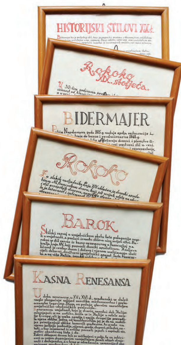
Sl. 9. Opće legende za pojedina stilska razdoblja postavljene u odgovarajuće prostore Muzeja – prvi stalni postav Odjela primijenjene umjetnosti na temu: Stilski razvoj namještaja (1951.); autor likovnog rješenja legendi: Jovan Gojković, foto: Vesna Barjaktarić, 2018.

A što se posla u Muzeju tiče, on se nastavlja. Unedogled. Još toliko toga treba obaviti. A sigurno je – uz puno borbe. I nemira.