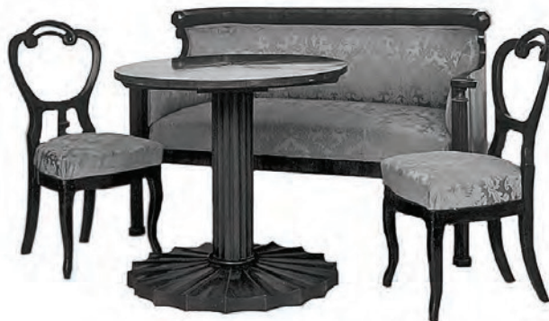
Sl. 7. Stalni postav Odjela primijenjene umjetnosti na temu: Stilski razvoj namještaja – razdoblje bidermajera: sofa, stol, dva stolca, Austrija, oko 1840. (MSO-U-140/1-2, MSO-U-141/a – b), Zbirka fotografija Muzeja Slavonije

vrijednost samoga djela (većina upravo ovih slika za nekoliko godina bit će trajno preseljena u buduću Galeriju slika). I izgled izložbenog prostora bio je malo drugačiji nego danas: središnji dio oba hola, prekriven daščanim podom, bio je u ravnini s kamenim podom hodnika (uzdignuti mramorni podesti postavljeni su poslije). Sve su prostorije imale vrata, što je oduzimalo dosta korisnog prostora (danas su skinuta, a otvori lučno završeni).