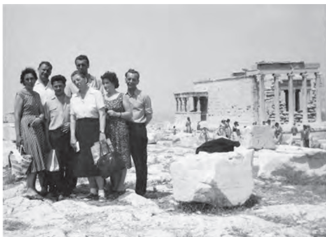
Sl. 3. Izlet kolektiva Muzeja Slavonije u Grčku u svibnju 1958. godine – muzealci pred Erehtejem na atenskoj Akropoli, Zbirka fotografija Muzeja Slavonije

U ovom radu Danica Pinterović prvo podnosi terensko izvješće vezano uz nalaz rimske zidane grobnice pronađene u dvorištu paromlina „Croatia“ u Osijeku, koristeći svoje bilješke iz Dnevnika rada . Već u tome postaje vidljiva sistematičnost njezina rada i pisanja. Prvo donosi važne vremenske i prostorne odrednice, a zatim postupno objašnjava korake koje je Muzej poduzeo prije sigurnog dovoza u svoje prostorije, objašnjavajući situaciju na terenu oko stanja nalaza te uvjete rada pri iskopu. Nakon toga detaljno opisuje rimsku zidanu grobnicu, izgled i dimenzije, a zatim i druge do tada u Osijeku pronađene rimske grobnice, pri čemu određuje tipove grobnica referirajući se na relevantnu europsku literaturu i tražeći paralele na području provincija Panonije i Mezije. Donosi i detaljno opisanu tipologiju rimskih grobnica, smještajući nalaze iz Murse u širi kontekst rimskih provincija. Zatim slijedi poglavlje o kasnoantičkoj rimskoj fibuli pronađenoj kod „Burze rada“ u lipnju 1947. godine gdje daje pregled razvoja fibula, a tek potom opisuje fibulu koja je tema poglavlja. Treću temu čini antička ženska portretna glava, također pronađena kod „Burze rada“ 1947., koju detaljno opisuje i na temelju frizure smješta u doba Severa. 21