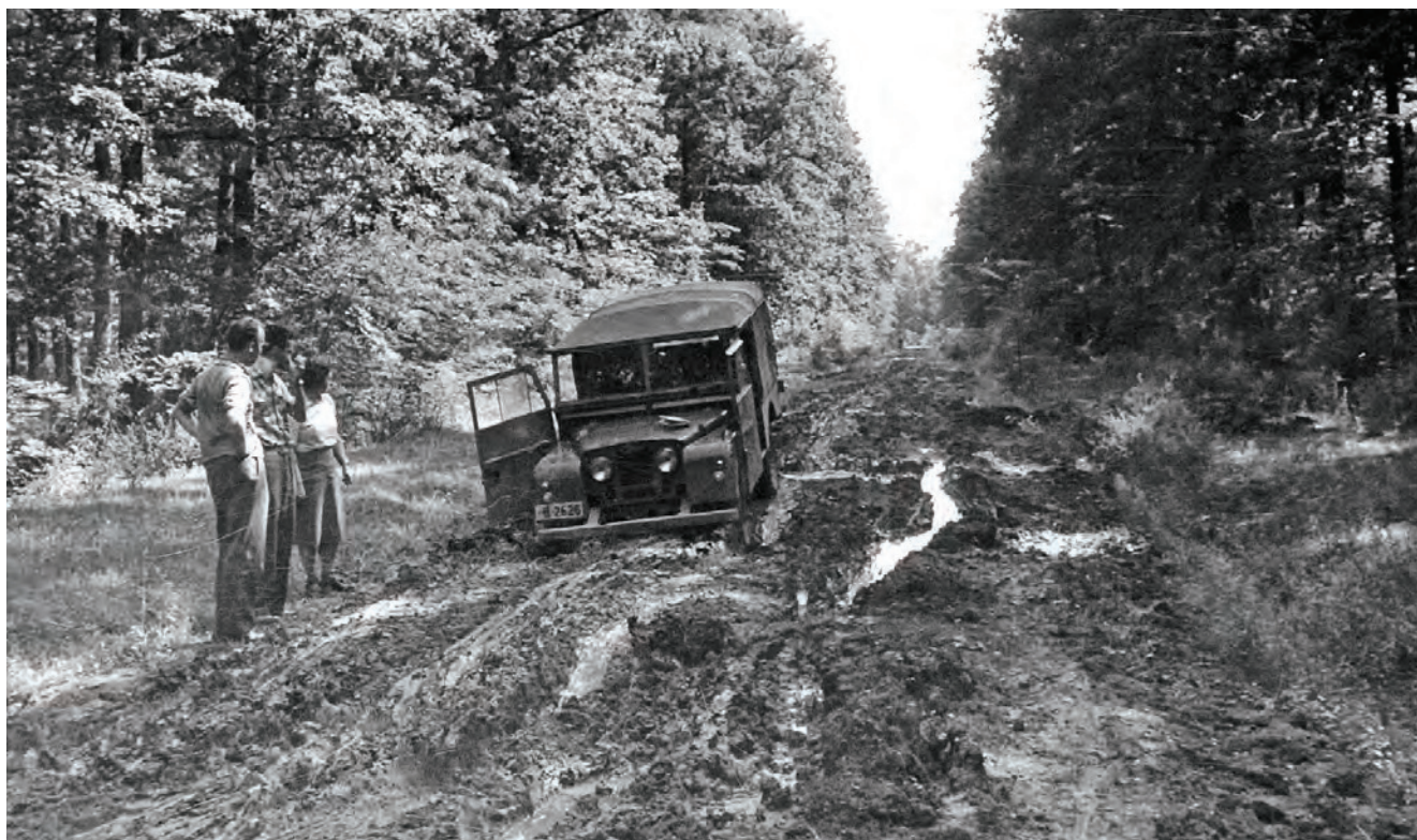
Sl. 2. Prizor s jednog konzervatorskog terenskog obilaska, Donja Dolina, MK, UZKB – F, inventarni broj 24463, Nino Vranić, 1960.