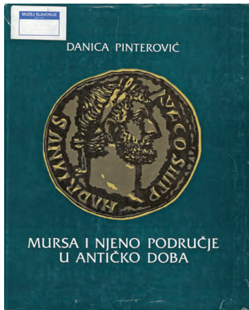
Pinterović, Danica. Mursa i njeno područje u antičko doba (omot)