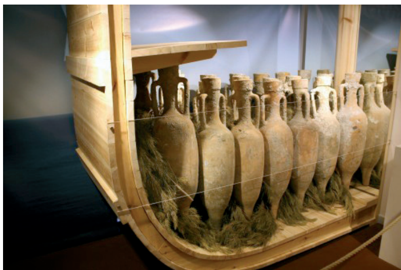
Slika 2. Rekonstrukcija amfora posloženih za transport 57

namijenjeno prodaji, pečatilo u amfore, s dodatkom aroma (npr. timijan, menta, cimet, med; rijetki luksuz bio je dodatak šećerne trske, uvezene iz Male Azije). 55 Na pečatu je bio upisan datum proizvodnje, ime proizvođača i područje uzgoja grožđa. Najcjenjenija su vina bila ona s egejskih otoka. Grčka su se vina izvozila po cijelom Sredozemlju te se vinogradarstvo u prvoj polovici 1. tisućljeća prije Krista razvija u najvažniju gospodarsku granu Grčke. Važnost vina očituje se u tome što se bogatstvo vodećih obitelji temeljilo na posjedovanju vinograda. Vino, dakle, predstavlja temelj grčkog gospodarstva. Grci su ga pili samo pomiješano s vodom jer se pijenje čistog vina smatralo barbariskim običajem. 56