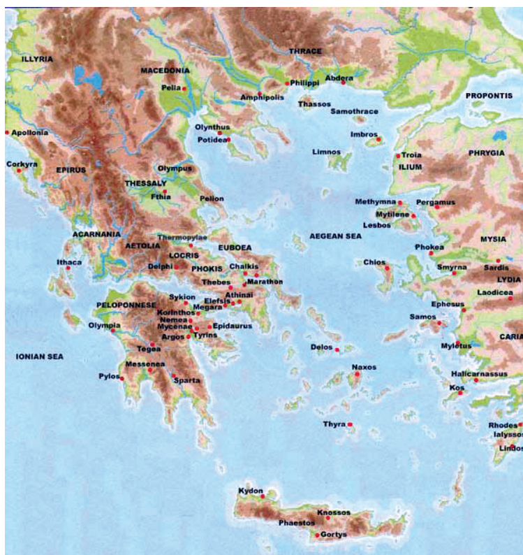
Slika 1. Karta antičke Grčke 4

bio pogodniji za stočarstvo nego za zemljoradnju. 2 Međutim, povoljna klima jednim dijelom nadoknađuje malen postotak obradivih površina te pogoduje uzgoju voća i povrća. Ljeta su topla, a zime u obalnim područjima i južnim predjelima blage. 3 U radu je na početku dan pregled povijesnog razvoja agrarnih sustava, tj. opisan je sustav kultura na posječenim šumama i sustav oranica na ugaru, a zatim su objašnjeni i zemljišni odnosi u antičkoj Grčkoj, kao i podjela zemljišta u grčkim kolonijama Faru i Isi, uz osvrt na Lumbardsku psezizmu. Pobljiže su opisane i biljne vrste koje su se kultivirale te značaj koji su one imale u pogledu mitoloških objašnjenja i običajnih uporaba. Naposljetku je objašnjeno kako su se izbijanja ratova, tj. neprijateljski napadi, zbog ciljanog uništavanja usjeva i uroda, negativno odražavali na poljoprivrednu proizvodnju.