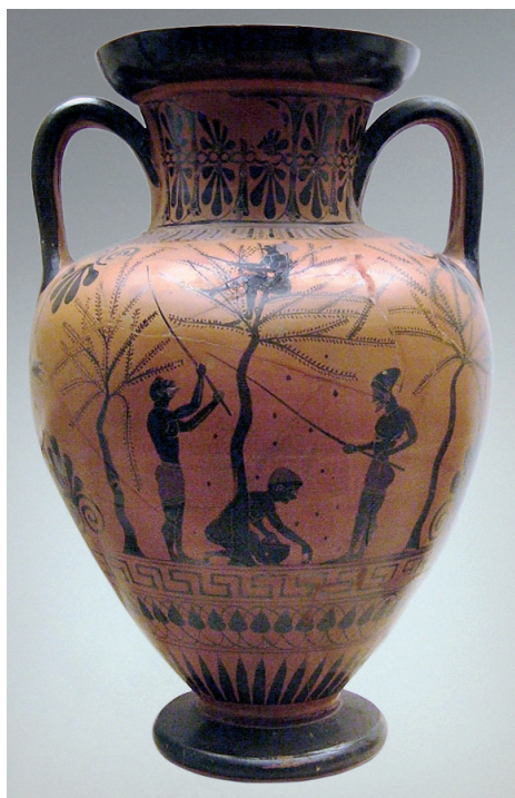
Slika 3. Prikaz sakupljača maslina na grčkoj vazi, o. 520. pr. Kr. 64

Maslina se u Grčkoj pojavila oko 2500. godine pr. Kr., 59 a dok se uzgoj maslina i proizvodnja ulja nisu raširili po cijelom Sredozemlju, cijena ulja je bila osjetno viša od cijene vina. Ulje se pretežito koristilo kao melem – današnju ulogu začina tada je imala životinjska mast. 60 Do 8. stoljeća pr. Kr. u Grčkoj je prevladavala divlja maslina, a to je drveće donosilo skroman urod te su plodovi imali malen udio ulja. 61 Tek u 5. stoljeću pr. Kr. masline dobivaju na važnosti. 62 Brale su se ručno ili uz pomoć dugačkih trstika pogodnih zbog svoje savitljivosti. Masline se tiještilo u stupama s rupom na dnu, kuda je istjecao kom. Taj se ostatak koristio kao gnojivo ili za impregnaciju drva i kože. Za obradu maslina koristila se i drobilica. Ona se sastojala od dva uglavljena okrugla kamena, od kojih je samo jedan bio pokretan. 63