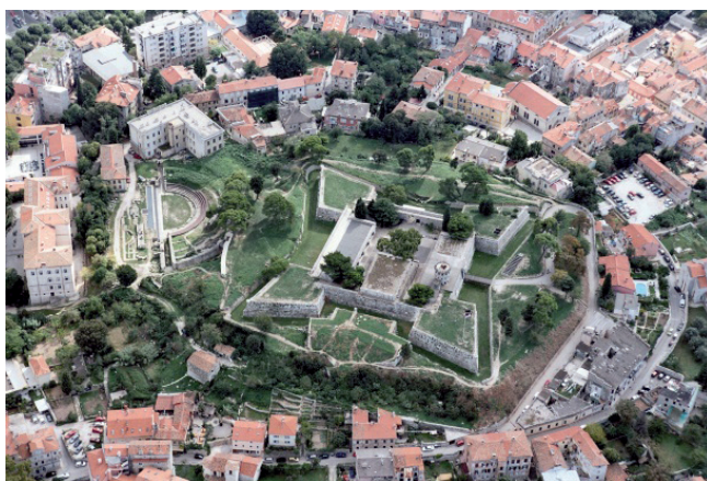
Slika 5. Mletačka utvrda u Puli