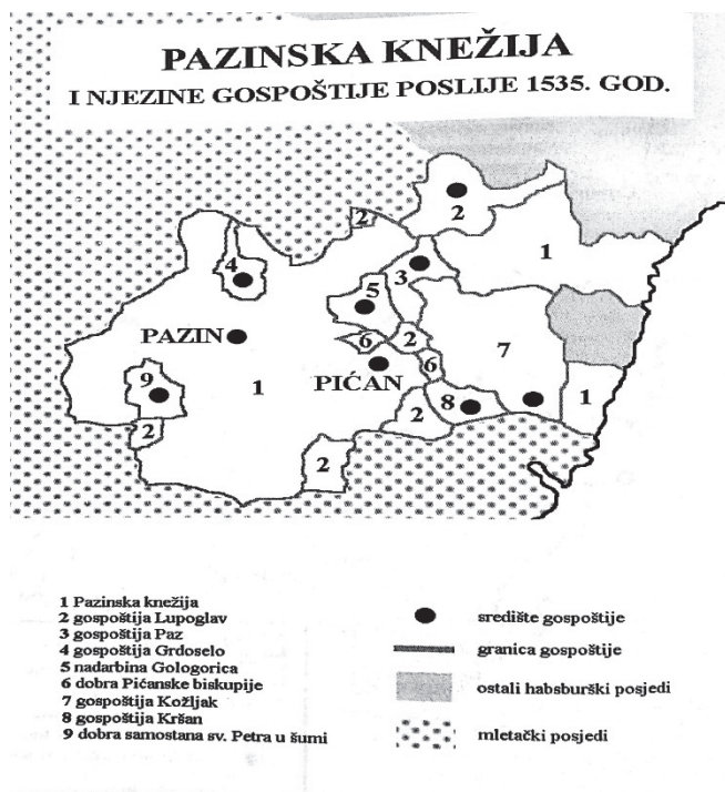
Slika 2. Ustroj Pazinske knežije

snih seljaka). Općinski sudski organ ( banca ) rješavao je seljačke i građanske sporove. Glavni organ seoske samouprave bio je župan, koji je ubirao desetinu i druge pristojbe, rješavao sporove, upravljao selom, bavio se pitanjima pašnjaka, šuma, održavanja pojilišta. Na njega je neuspješno pokušalo utjecati plemstvo. 23