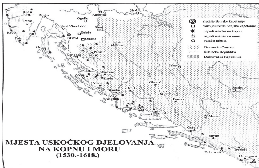
Slika 4. Uskočko djelovanje u Hrvatskoj

U sukobe između Venecije i Austrije su se uključili senjski uskoci. Vršili su razne napade na mletačke, kao i dubrovačke i turske lađe, ali su napadali i mletačke primorske gradove. Pula i Rovinj 1597. odbijaju napade, kao i Labin dvije godine nakon, ali je Plomin pao pod uskočku vlast. Mlečani su uzvratili blokadom Trsta, slanjem flote koja je bombardirala Rijeku i Lovran, te napadima soldateske (surovih ratnika) i seljaka na Pazinsku knežiju. Rat se nastavljao uskočkim upadima i mletačkom retelijacijom 1607. (Pula), 1609., 1612. i 1614. godine, što je nanijelo golemu štetu gospodarstvu i političkim prilikama. 29