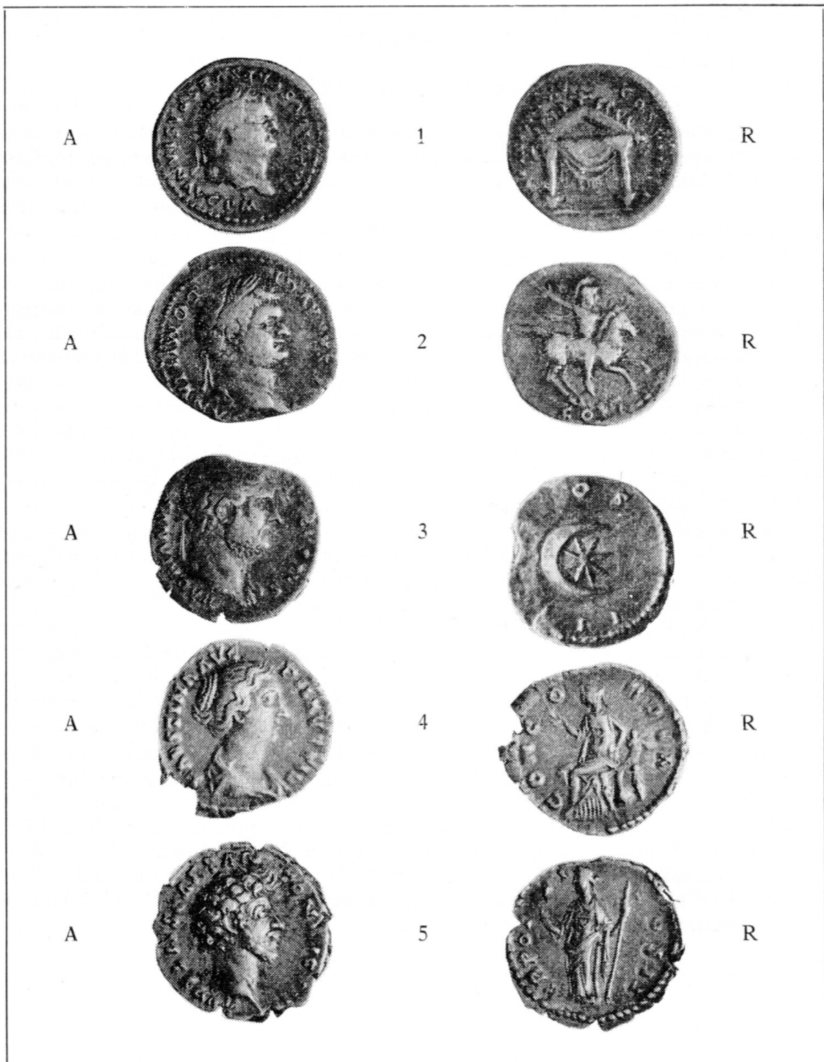
T. I Marija na Muri 1966.g. Ostava srebrnog novca II st. n.e. Broj na tabli odgovara rednom broju na katalogu. Mjerilo cca 1:2,5

Marija na Muri 1966. Silbergeldfund des II Jhd. Die Numer an der Tafel entspricht der Katalognumer: Mass cca 1:2,5