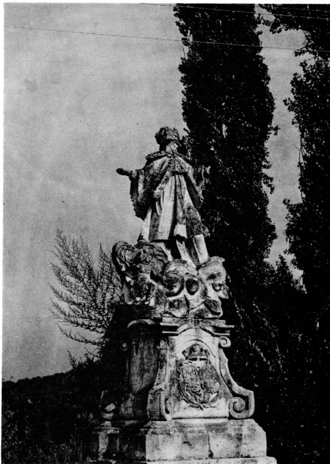
Sl. 2. Klenovnik, spomenik sv. Ivana Nepomuka, 1766 (Foto: D. Baričević, 3. VIII 1979) Klenovnik, Statue des hl. Johannes von Nepomuk, 1766 (Foto: D. Baričević, 3. VIII 1979)