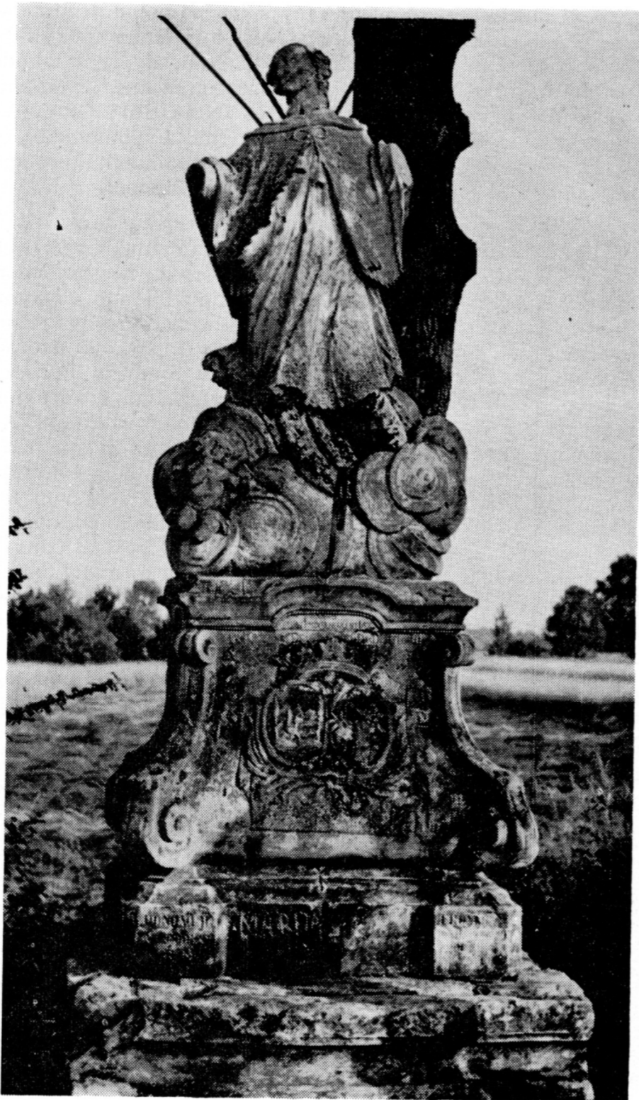
Sl. 3. Veliki Bukovec, spomenik sv. Ivana Nepomuka, 1767 (Foto: D. Baričević, 28. V 1973) Veliki Bukovec, Statue des hl. Johannes von Nepomuk, 1767 (Foto: D. Baričević, 28. V 1973)