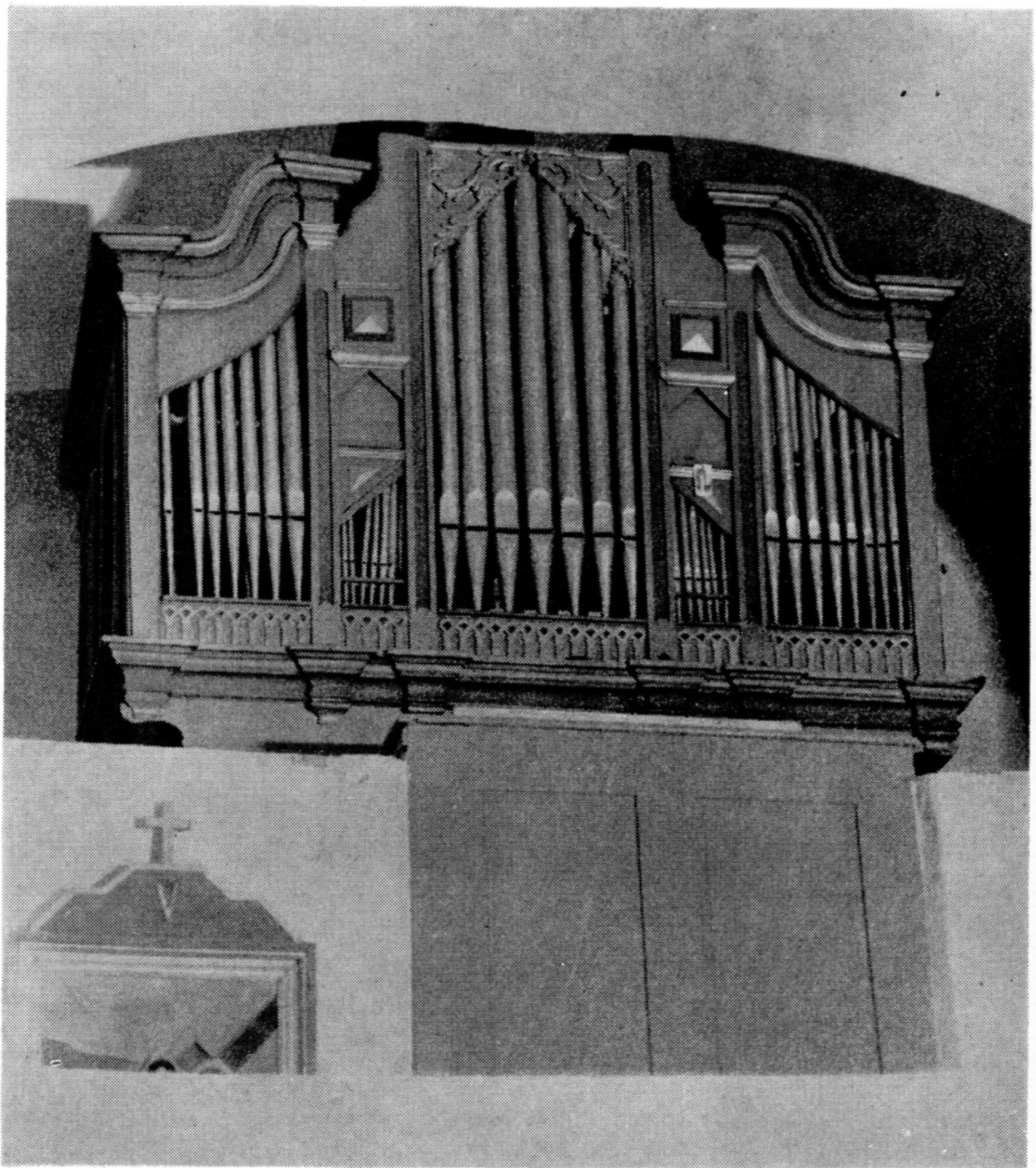
Sl. 3. Orgulje u Knegincu (Foto: N. Vranić) Die Orgel in Knebinec (Foto: N. Vranić)

kanala i u samoj zračnici potpisao se Papin pomoćnik Valentin Duh, koji je iste godine popravljao orgulje isusovačke crkve u Varaždinu. 30 Dispoziciju v. u tabeli.