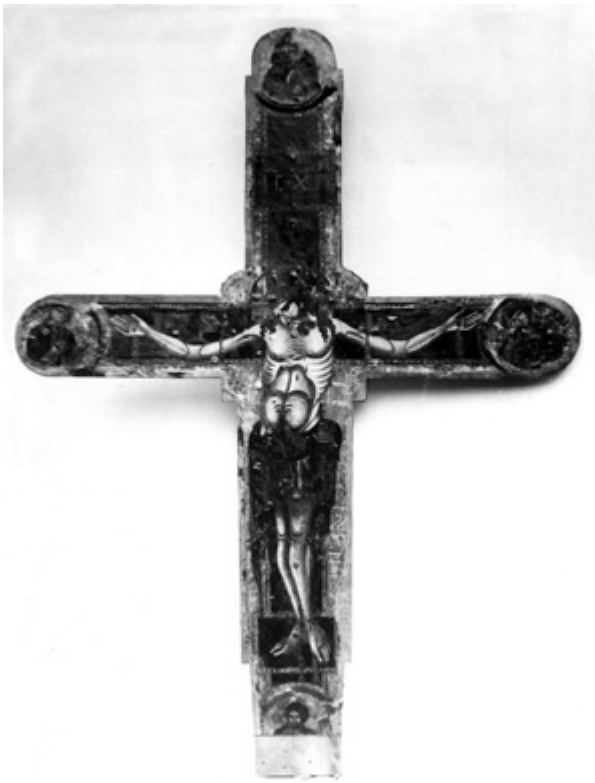
5. Raspelo poslije zahvata 1959. godine Crucifix after the 1959 conservation

istaknuvši da osim umjetničkog te umjetnine imaju i nacionalno značenje.