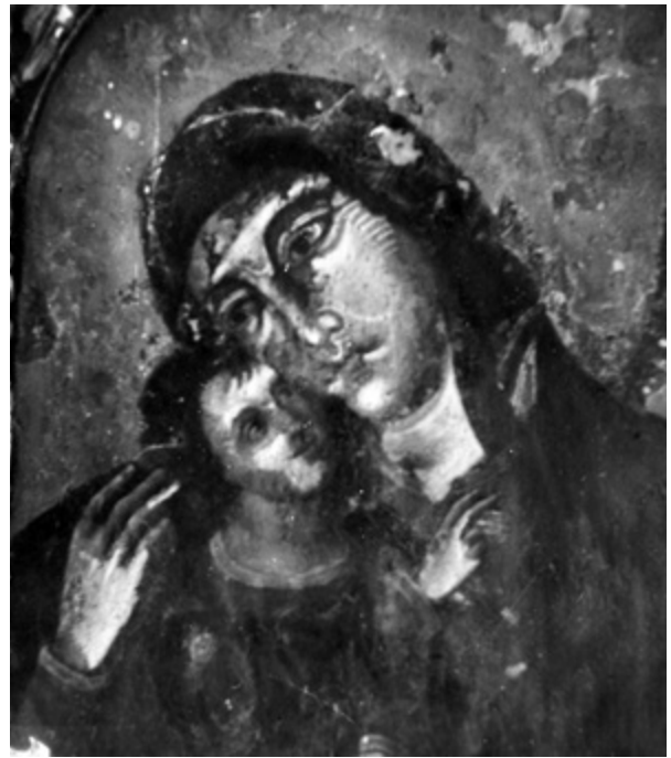
7. Slika tijekom zahvata Painting during conservation

koji način valorizirati povijesne i estetske vrijednosti umjetničkog djela dobila su međunarodni karakter. 46 Te su teme okupirale i Cvitu Fiskovića, pa je u dopisu iz 1958. godine, poslanom redakciji Vjesnika u Zagrebu, istaknuo: „Pri poslu konzerviranja treba uvijek uskladiti naučno proučavanje i ispitivanje objekta na kojem se vrši konzervatorski zahvat i način njegove zaštite i valoriziranja njegovog značenja.“ 47 Rješenje je vidio u organizaciji koja se temelji na zajedničkom radu povjesničara umjetnosti i restauratora komplementarnih znanja i vještina, koji imaju zajednički cilj i entuzijazam u analiziranju umjetničkih djela te uzajamnu odgovornost u konačnom restauriranju. 48 Upravo su zato važna njegova razmišljanja o restauriranim umjetninama, poput onih objavljenih u članku Riječ pri otvaranju izložbe restauriranih umjetnina u Splitu , objavljenom u časopisu Mogućnosti 1968. godine: „Popravljen i očišćen umjetnina je spašena od daljnjeg propadanja; ona više nije zabačena, već registrirana, a često i objavljena; preko nje je izložene, osvježene i osigurane pristup javnosti k majstorovu izrazu neposredniji; stručnjaci pak u njoj mogu jasnije uočiti odlike njegove ruke, znak njegove škole i vremena.“ 49