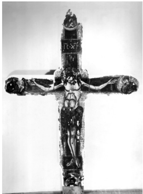
4. Raspelo tijekom zahvata 1959. godine Crucifix during the 1959 conservation

razdoblja. 33 Posvjedočio je nepovoljnim uvjetima njihova smještaja u malim muzejima, crkvenim riznicama te gradskim i privatnim zbirkama, što je dakako ubrzavalo već odavno započet proces degradacije krhkih materijala. U tim je umjetninama, kako sam piše, vidio „vjekove naše prošlosti“, a njihovu spašavanju posvetio je cijeli radni vijek.