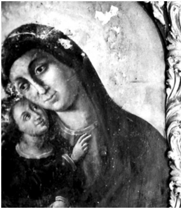
6. Bogorodica s Djetetom iz crkve sv. Stjepana na Sustipanu prije zahvata Madonna and Child from the Church of St. Stephen on Sustipan, before conservation