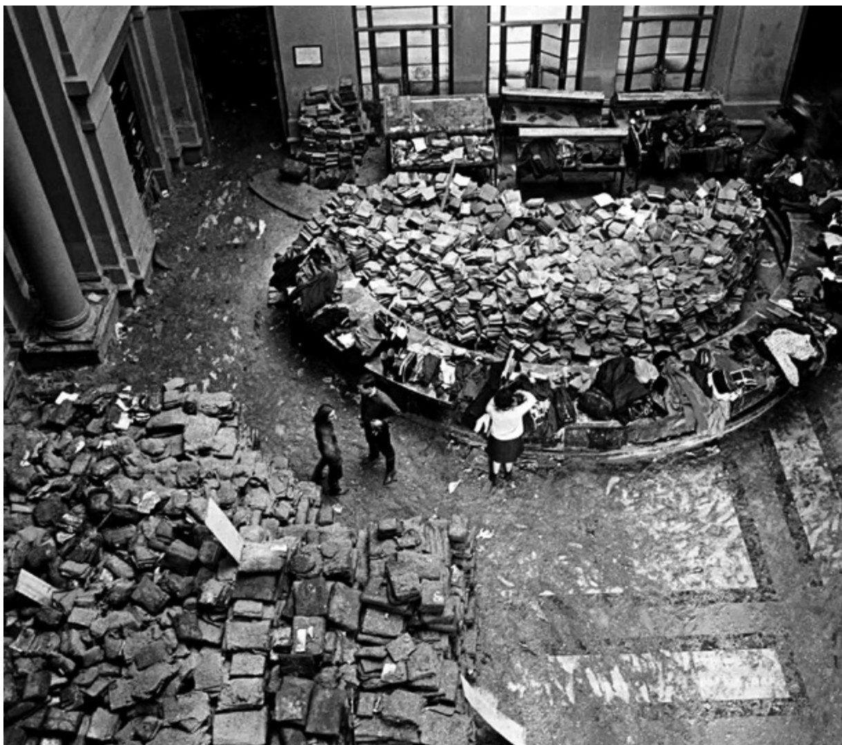
4. Poplava u Nacionalnoj knjižnici u Firenci 1966., Left.it (Biblioteca Nazionale Centrale, snimio B. Korab, 1966.) Flood at the National Library in Florence in 1966, Left.it (Biblioteca Nazionale Centrale, B. Korab, 1966)

nego na temperaturi od -20 do -30 °C. Na građi tiskanoj na papiru s premazom primijećena su nepovratna sljepljivanja, pogotovo na knjigama čuvanima na relativno visokim temperaturama. 13