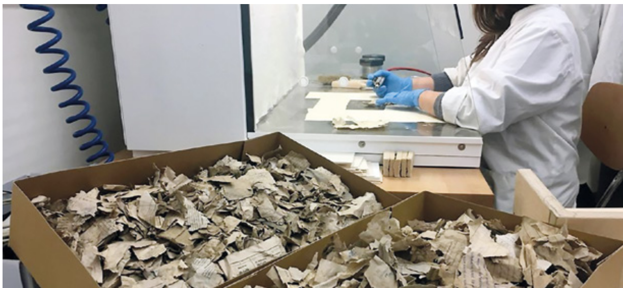
6. Gedächtnis von Köln , koji je tijekom urušavanja rastrgan u tisuće komadića, restauratorica ponovno sastavlja pincetom (Kölner Stadtarchiv, snimio R. Goldmann, 17. ožujka 2017.) Restorer reassembling Gedächtnis von Köln, torn into thousands of pieces during the collapse, using tweezers (Kölner Stadtarchiv, R. Goldmann, 17 th March 2017)

tintom topivom u vodi. Zbog individualnog rukovanja svakim gradivom, ta metoda je najskuplja metoda sušenja. 33