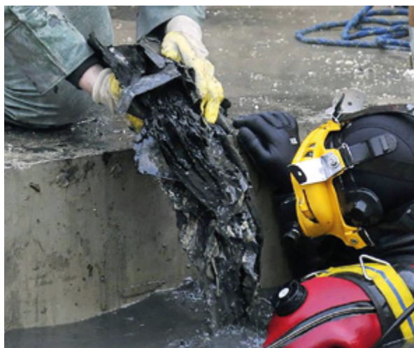
5. U dijelu ruševina koji je ispunjen podzemnom vodom ronici vade vrijedne dokumente (WDR) Divers retrieving valuable documents from ruins filled with groundwater (WDR)

Kao najjednostavnija i najstarija metoda sušenja vlažnog gradiva koristi se metoda sušenja na zraku . Primjenjuje se u slučajevima sušenja manje količine vlažne, ne potpuno namočene građe. Postupak se temelji na sušenju gradiva sušilom za kosu, umetanjem bugačica koje upijaju vlagu iz papira ili pak laganim brisanjem čistim spužvama, a s obzirom na to da ne zahtijeva nikakvu posebnu opremu, smatra se i najjeftinijom metodom. U slučaju sušenja bugačicama, uvezane jedinice vlažne građe postavljaju se na upijajući materijal na „glavu“, nakon čega slijedi otvaranje korica knjige, pri čemu listovi ostaju slijepljeni. Polaganim sušenjem na zraku, osušeni listovi gradiva počinju se sami odvajati jedni od drugih u obliku lepeze. Potom se između stranica umeću bugačice 30 koje moraju biti većih dimenzija od dimenzija knjige, a njihov broj ne smije biti veći od jedne trećine debljine knjige kako ne bi uzrokovale deformacije. Upijajući materijal