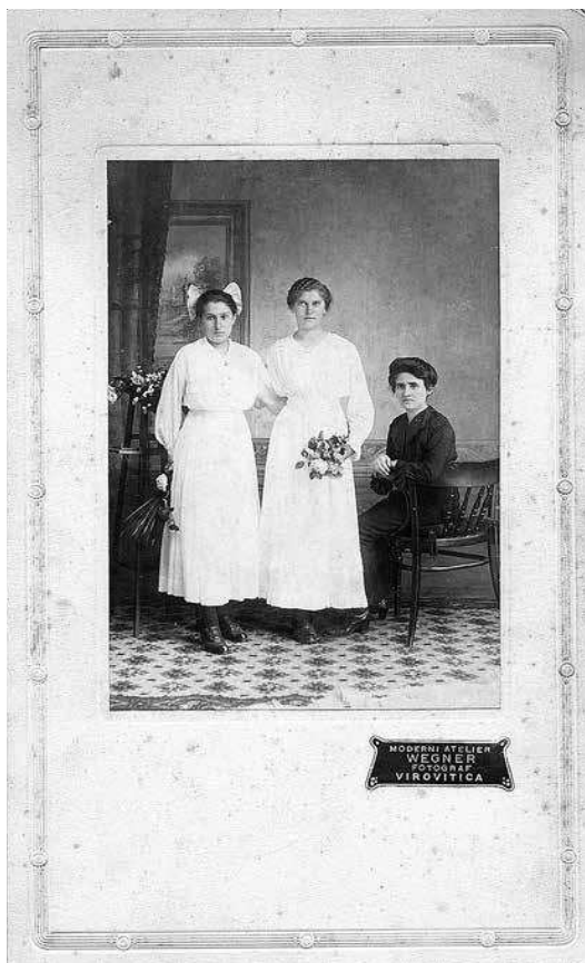
sl.7. Milan Šimić: Iz obitelji Gavrančić