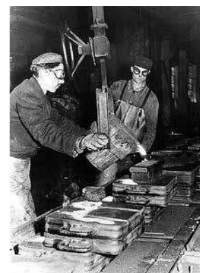
sl.14. Foto albumi iz ostavštine Milana Nikolića