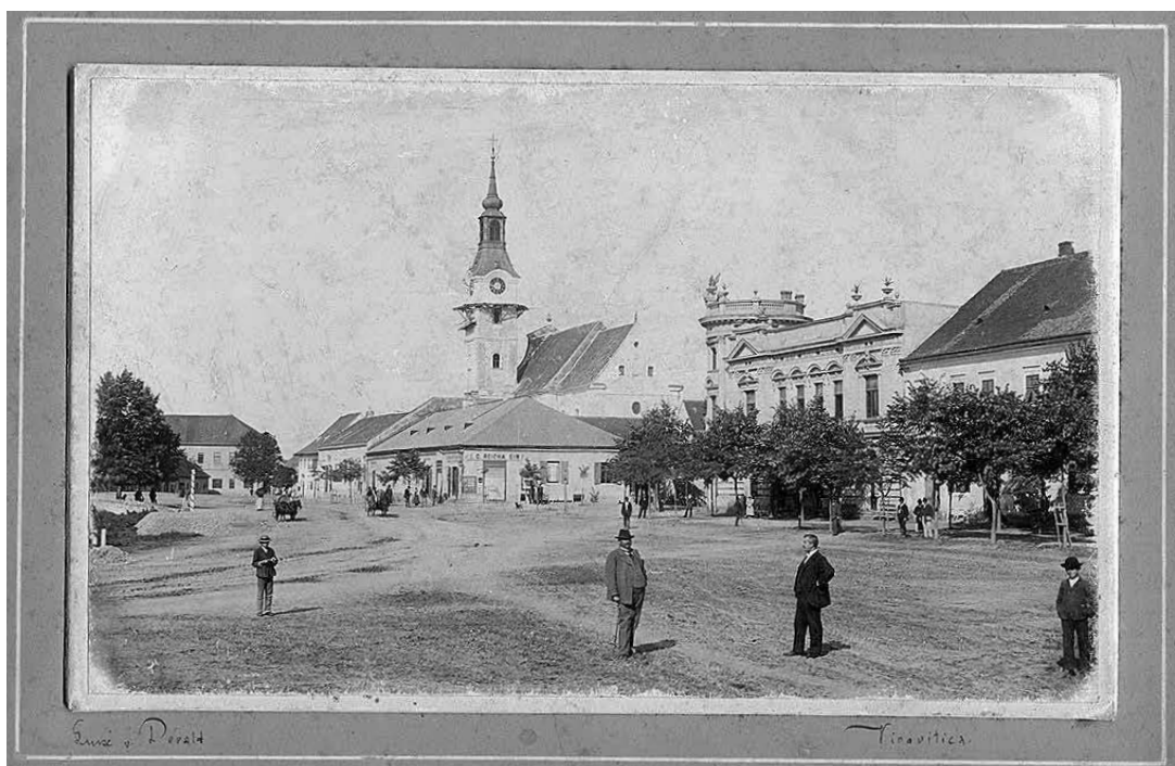
sl.2. Nepoznati putujući fotograf: Veduta Virovitice prije 1887.