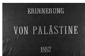
sl.9. Album fotografija Erinnerung von Palestine , 1887.