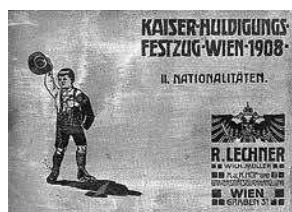
sl.15. Album fotografija svečane povorke u čast 60. obljetnice carevanja Franje Josipa