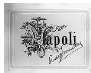
sl.12. Prva stranica albuma fotografija Napulja s kraja 19. st. s potpisom grofa Rudolfa Normanna