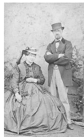
sl.12. Detalj stalnog postava: Kultura odijevanja