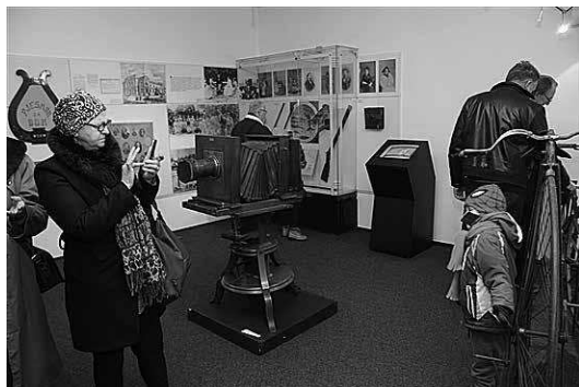
sl.3.-4. Fotografski aparat u stalnom postavu postao je posjetiteljima zgodna točka za snimanje selfieja .