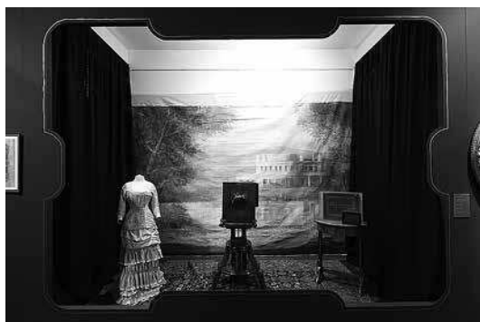
sl.1. Fotografski atelijer na izložbi Afrika – Karlovačani u Africi u drugoj polovini 19. i početkom 20. stoljeća , 2013.