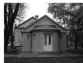
sl.5. Atelijer Stjepana Šantića danas URL: https://www.karlovac-touristinfo.hr/hr/galerija-ulak (posjećeno 8. ožujka 2018.) Od 2008. u vlasništvu je Udruženja likovnih autora Karlovac (ULAK-a), kojemu služi kao izložbeni prostor.

Izlaganje originalnih fotografija iz 19. st. popraćeno je nizom ograničenja. Naime, uvjeti okoline u kojima se fotografije izlažu različiti su od spremišnih i donekle nepovoljno utječu na fotografije, pri čemu treba posebice voditi brigu o kontroliranoj rasvjeti, temperaturi, relativnoj vlazi te mikrookolini u izložbenom prostoru i vitrinama. 6 Stoga se postavlja pitanje nije li digitalizacija zbirke i prezentacija putem zaslona osjetljivoga na dodir umjesto izlaganja faksimila bolje rješenje. Prezentacija putem zaslona osjetljivoga na dodir zasigurno pridonosi