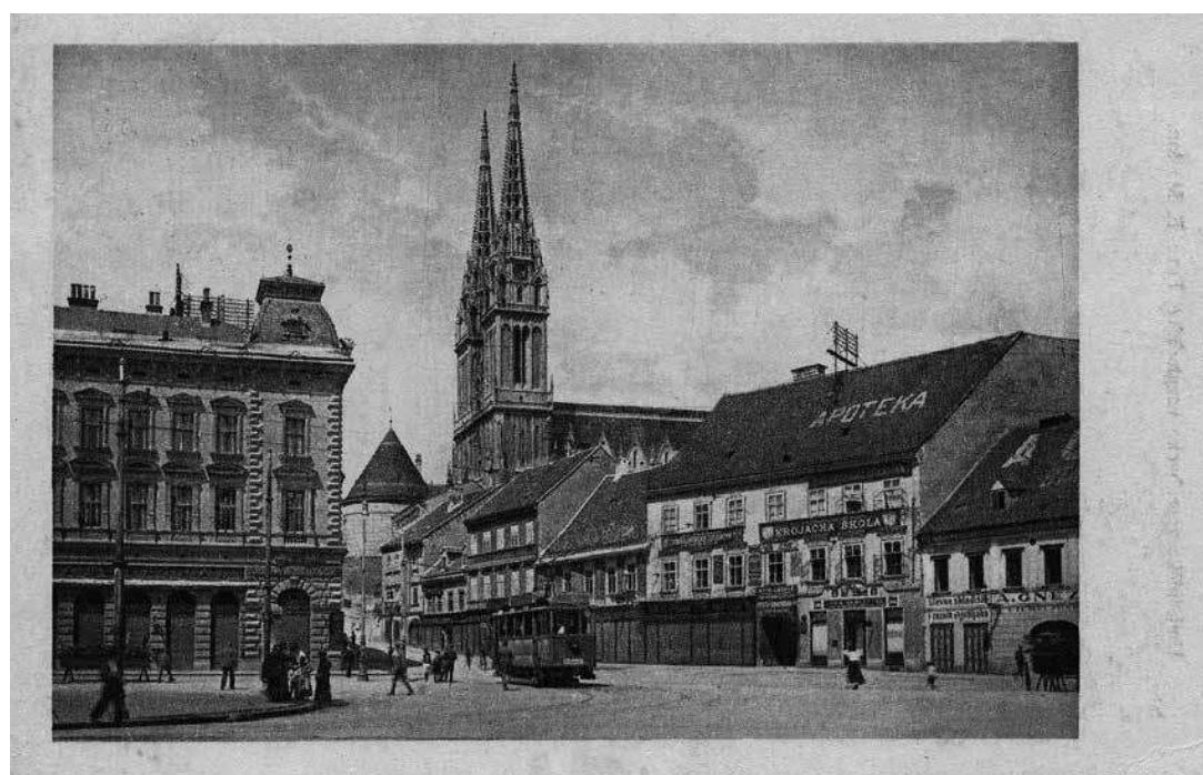
sl.5. E. Marton: Trg bana Jelačića, oko 1920.

ih ima, posudi ili pokloni u zbirku, koja će s vremenom postati najvažniji izvor za proučavanje razvoja našega glavnoga grada. 5