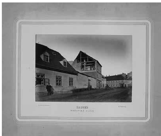
vijećnica, dolazak Franje Josipa 1895. i poplava u Zagrebu 1898. 3

O ranim danima Muzeja grada Zagreba i djelovanju u skućenim prostorima te o čuvanju i izlaganju prispjelih fotografija podatke donosi dr. Franjo Buntak (ravnatelj Muzeja od 1946. do 1979.). Prema podacima koje je uspio prikupiti, u opisu prve lokacije Muzeja na Kamenitim vratima uz samo dvije izložbene prostorije spominje se hodnik koji je služio kao izložbeni i skladišni prostor: Tu su visjeli (...), zatim uokvirene fotografije panorama i pojedinih dijelova grada te raznih zgrada i drugih objekata i događaja od šezdesetih do kraja devedesetih godina prošlog stoljeća (pogledi na grad sa Štrosmajerova šetališta i iz savske nizine, skupine fotografija u okvirima pod staklom iz 1864. i 1888., stara vojarna u Petrinjskoj i porušene kuće u Bakačevoj ulici, slikovita Kaptolska