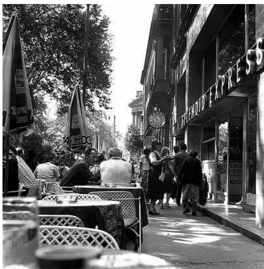
sl.10. Marija Braut: Restoran Splendid, 1980.

Najveća od svih, Zbirka Šime Radovića obuhvaća približno 100 000 predmeta. Sadržava negative i pozitive koje je Šime Radović kao dugogodišnji fotoreporter snimio tijekom rada za novine Borba , Vjesnik , Zagrebačka panorama , Revija Zagreb , te u vrijeme kada je bio suradnik Globusa , Večernjeg lista , Studija , Arene , Oka , Vikenda i Starta .