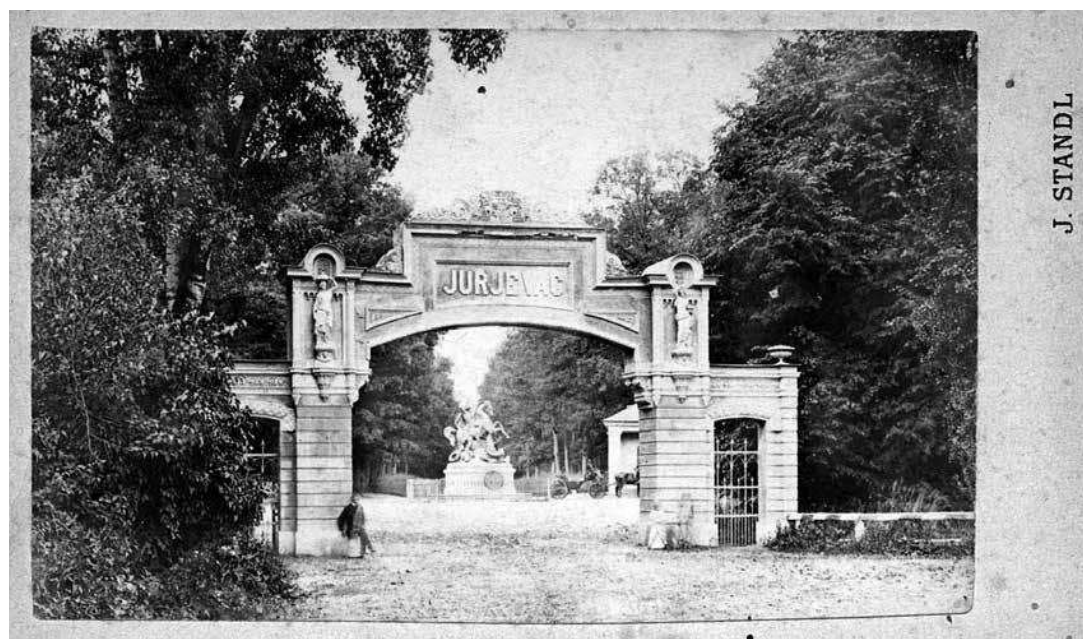
sl.4. Ivan Standl: Ulaz u Maksimir, 1871.