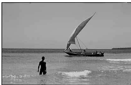
sl.7.-9. © Vladimir Kostjuk: Afrika Tanzanija, 1989.

su sve fotografije na istom papiru i bez ruba. Kostjukove dokumentarne muzejske fotografije iz ciklusa tradicijske arhitekture Podravine prva su ozbiljna i unaprijed promišljena autorska cjelina, a zahvaljujući Muzeju grada Koprivnice i kustosici Sonji Kolar, očuvane su, opisane i autorizirane. Iz ranog razdoblja 1960-ih svakako valja spomenuti Kostjukov portret dr. Leandera Brozovića objavljen u Gradi za povijest Koprivnice (Muzej grada Koprivnice, 1978.), snimljen 1962., koji je, koliko je zasad poznato, posljednji službeni portret osnivača i prvog kustosa Muzeja grada Koprivnice.