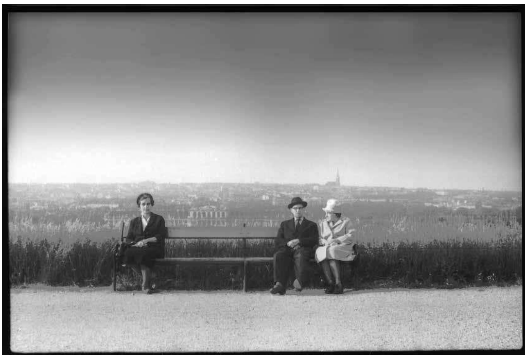
sl.2. © Vladimir Kostjuk: Wien, bečki ciklus, 1967.

kojoj se pohranjuju dokumentarne i terenske fotografije, danas uglavnom u digitalnom formatu.