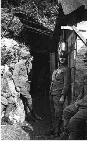
sl.10. Sianki: Totalni pogled, lipanj 1917.