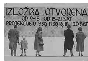
sl.4. XI. međunarodna izložba umjetničke fotografije 1955., Obavijest o radnom vremenu Dokumentacija Umjetničkog paviljona u Zagrebu

Od suvremenih fotografa Zoran Filipović je 2006. na izložbi Kiklopovo oko predstavio deset ciklusa fotografija, a u suradnji s MSU-om 2007. organizirana je izložba Edith von Welser-Ude Oživljeni zidovi – prizori iz života , koja je obuhvatila tri ciklusa fotografija. Na izložbi Život u slikama / South – Southeast, A Life In Pictures 2012. svjetski poznati Steve McCurry izložio je 101 fotografiju, a 2014., u sklopu Zagrebačkoga kulturnog ljeta , na izložbi Zagreb u objektivu Ive Pervana , izloženo je 40 fotografija. Od srpnja do rujna iste godine na izložbi