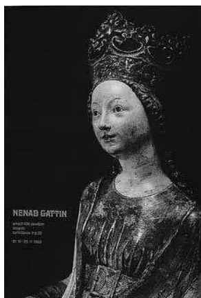
sl.5. Plakat izložbe Nenada Gattina, 1969.