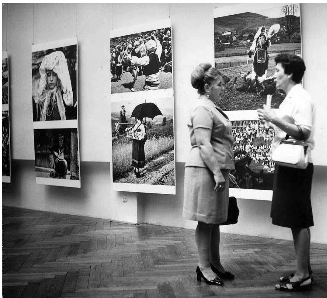
Nepoznati Zagreb Marije Braut predstavljena je 71 fotografija iz opusa te umjetnice.