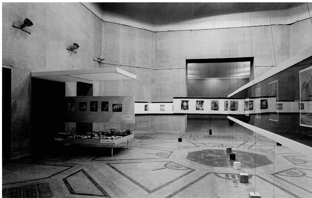
sl.2.-3. XII. međunarodna izložba umjetničke fotografije, 1957., postav izložbe vl. Vladko Lozić