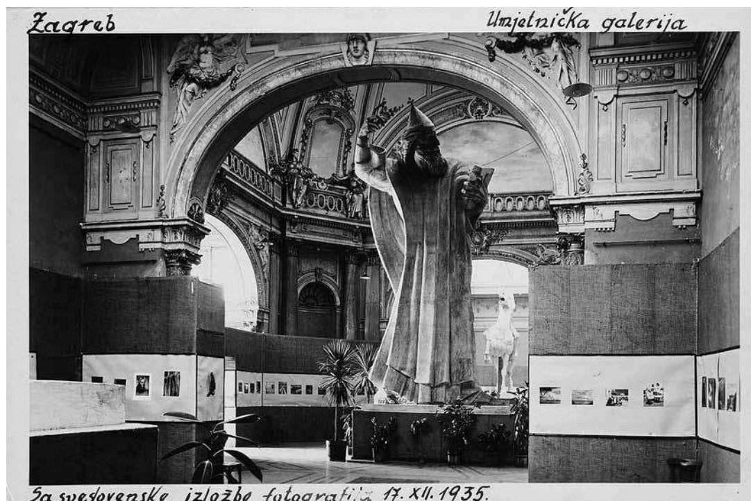
sl.1. Ljudevit Griesbach I. sveslavenska izložba umjetničke fotografije u Zagrebu MCMXXXV : Priredba Fotokluba Zagreb, Umjetnički paviljon Zagreb, 17.XI.-8.XII.1935. Zahvaljujemo Hrvatskom državnom arhivu u Zagrebu na ustupljenoj digitalnoj presnimci.

NIKOLINA HRUST □ Umjetnički paviljon u Zagrebu, Zagreb