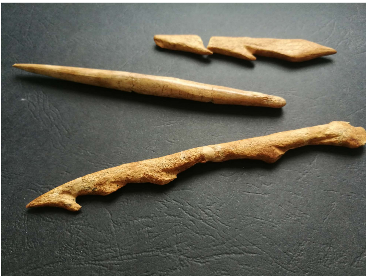
Slika 6. | Koštani harpuni | Foto: Dario Vujević

O lovnim vještinama paleolitičkih stanovnika pećine, osim ostataka njihovog ulova svjedoče i brojni ostatci oružja za lov i oruđa za obradu ulovljenog plijena. Stanovnici pećine su uspješni lovci koji koriste kako male projekte s hrptom tako i velike kremenene šiljke koji su pronađeni među desecima tisuća kremenih izrađevina. Tipološke i tehnološke karakteristike alata kroz cijelo vrijeme ukazuju na razdoblje epigravetijena, s tim da najdublji slojevi vjerojatno