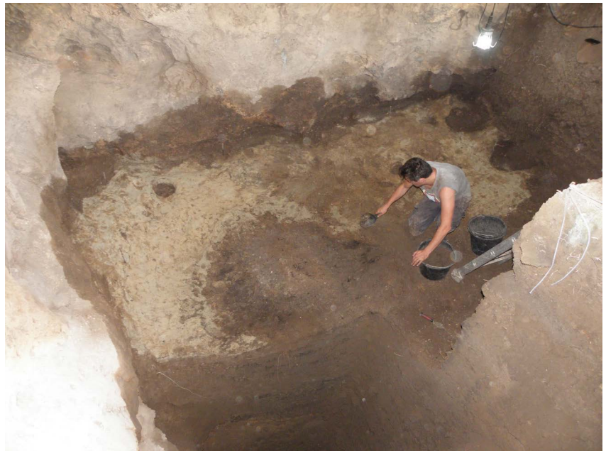
Slika 4. | Sloj tefre

aktivnosti u površinski sloj dospjela je i manja količina materijala iz mlađih kulturnih razdoblja (Vujević i Bodružić, 2012). Intaktni mezolitički slojevi nižu se do 9.880 kal. god. pr. Kr (Radović i sur. u tisku), nakon čega slijedi period prijelaza na pleistocensko razdoblje. Stratigrafija Vlakna time nam pruža rijetku mogućnost uvida u promjene koje su zahvatile pleistocenske zajednice na prijelazu u postglacijalni okoliš. Litički nalazi pokazuju postupni prijelaz na tipični mezolitički inventar, ali uz jasno izraženu epigravetijensku tradiciju. Jedino opada količina projektila, no to se uklapa i u promjene privrednih aktivnosti zajednica (Vujević i Bodružić u tisku). Iako lov u mezolitu i dalje igra važnu ulogu primjetno je smanjivanje udjela jelena ( Cervus elaphus ) u prehrani (Radović i sur. u tisku). Promjenom klime i stvaranjem holocenskog okoliša u kojem Dugi otok zaista postaje otok, zajednice jelena se smanjuju što prisiljava ljude na promjenu privrednih strategija. Rezultat toga je i prelazak na raznovrsniju prehranu koja uključuje puževe vinogradare ( Helix sp.), a kasnije i raznolike morske plodove i ribe. One u nalazima iz pećine većinom pripadaju oradama (Vujević i Bodružić 2012). Porast značaja morske komponente u privredi zajednica prate i nalazi ukrasnog karaktera, pri čemu u mezolitu glavni ukras čine