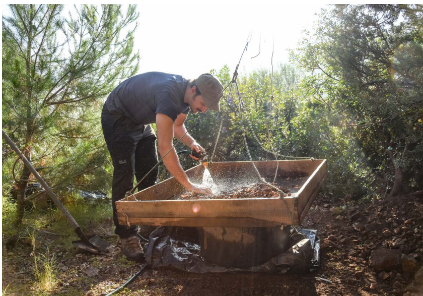
Slika 5. | Prosijavanje sedimenta

je svojevrsnu zaštićenu zonu i pogodno područje kako za biljke i životinje, tako i za paleolitičke zajednice lovaca-sakupljača (Shackelton i sur. 1984, 312; Miracle 2007, Whallon 1999, 338). Upravo to pokazuje i Vlakno. Iako brojčano mala, količina