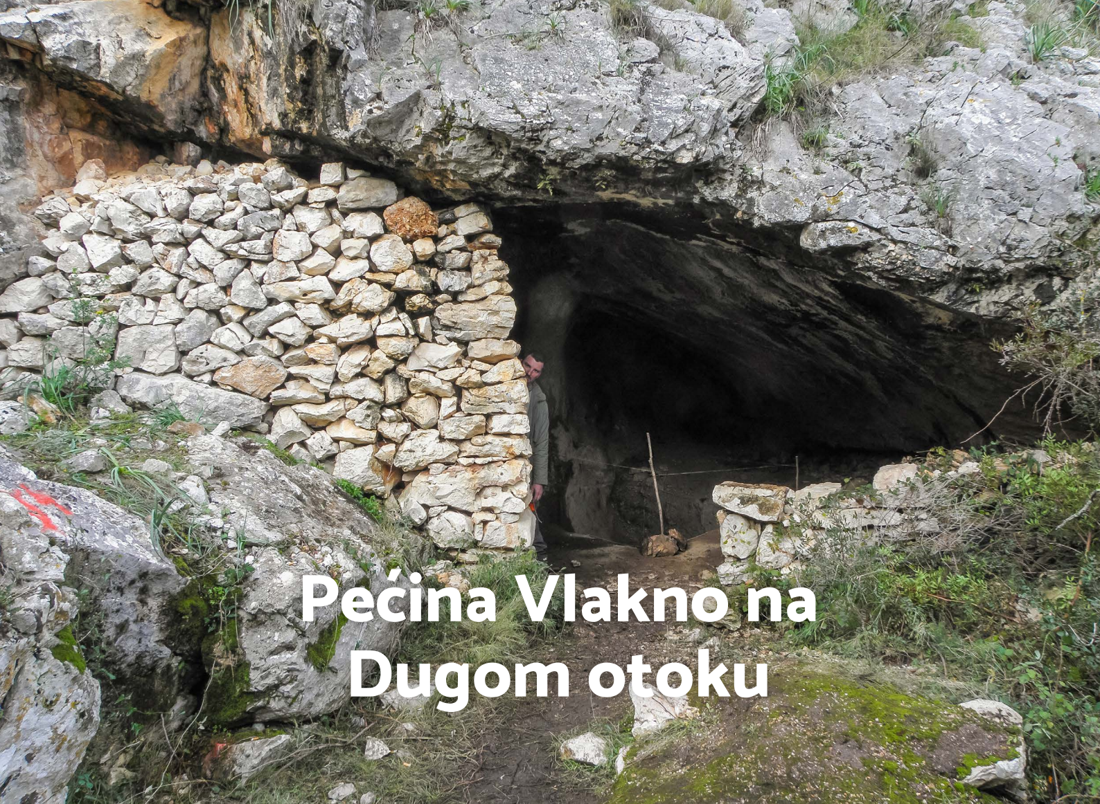
Slika 1. | Ulaz u pećinu Vlakno | Foto: Dario Vujević