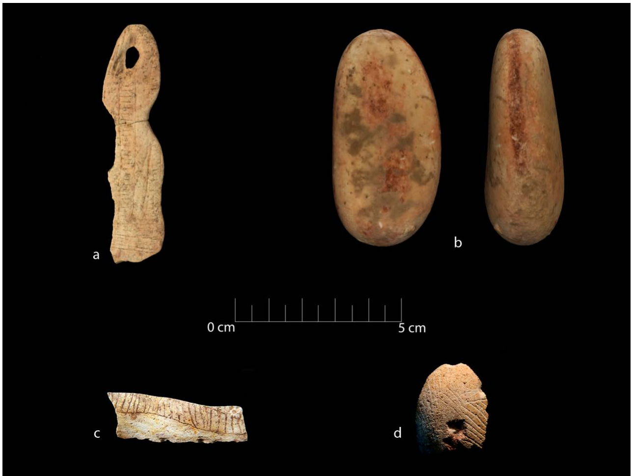
Slika 7. | Predmeti posebne namjene

pripadaju ranoj fazi (Vujević 2016). Kamena sirovina za izradu alata potječe iz lokalnih izvora i danas vidljivih na Dugom otoku, ali i s područja talijanskih regija Marche i Umbria (Vukosavljević i sur. 2014), što svjedoči o kretanju i kontaktima zajednica na širokom području danas poplopljene ravnice rijeke Po. Posebno mjesto u lovnom inventaru zajednica zauzimaju dva koštana harpuna, izrazito rijetka u južnoj i jugoistočnoj Europi sve do mezolitika (slika 6). U Hrvatskoj su pronađeni samo na lokalitetu Šandalja II kod Pule, a iz razdoblja kraja gornjeg paleolitika potječu i harpuni iz mlađih faza lokaliteta Badanj kod Stoca u BiH. Uz rijetkost ovakvih nalaza, starost harpuna iz Vlakna od 15.000 godina čini ih i najstarijim primjercima ove vrste oruđa na širem jadranskom području.