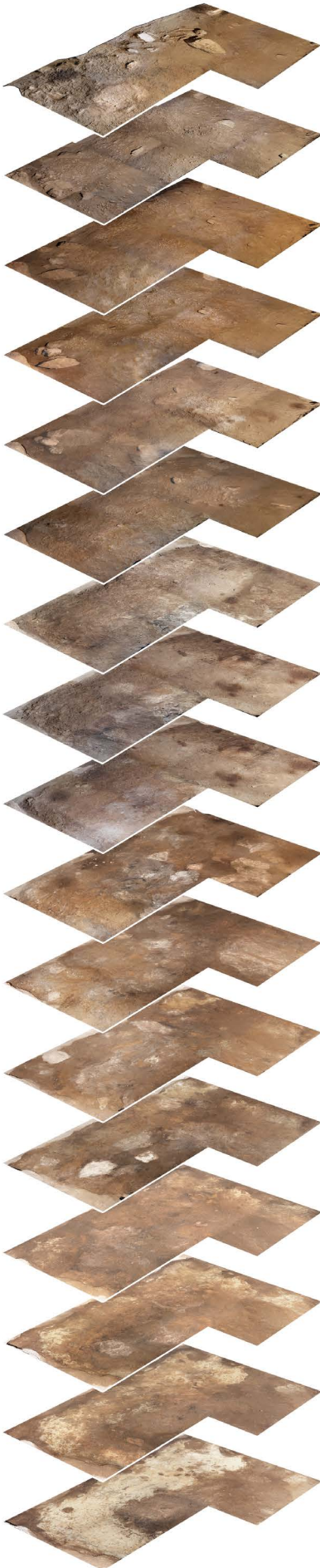
Slika 3. | Hodne površine