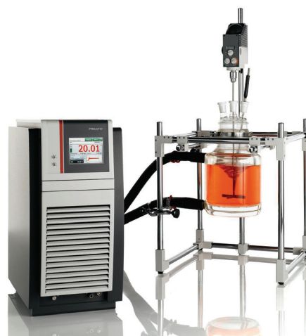
Slika 1 – Komercijalni termostatski sustav za regulaciju temperature u reaktoru

Ipak, nakon što je regulacijski krug temperature dobro ugođen, odstupanje je obično manje od granica pogreške mjernog osjetila i pretvornika.