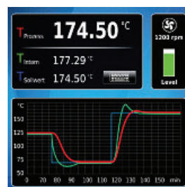
Slika 3 – Operatorsko sučelje

Vrhunski termostatski sustavi za regulaciju temperature jasno i organizirano prikazuju bitne informacije u obliku bročanih vrijednosti, grafikona i tekstualnih obavijesti. Sve te informacije valja prikazivati na većim zaslonima. Administrator sustava obično definira kategorije korisnika i postavke. Operatori imaju ograničena prava pristupa koja im omogućuju jednostavni rad i dohvaćanje tih postavki. To olakšava rad u laboratoriju i sprječava neželjene promjene parametara i kvarove.