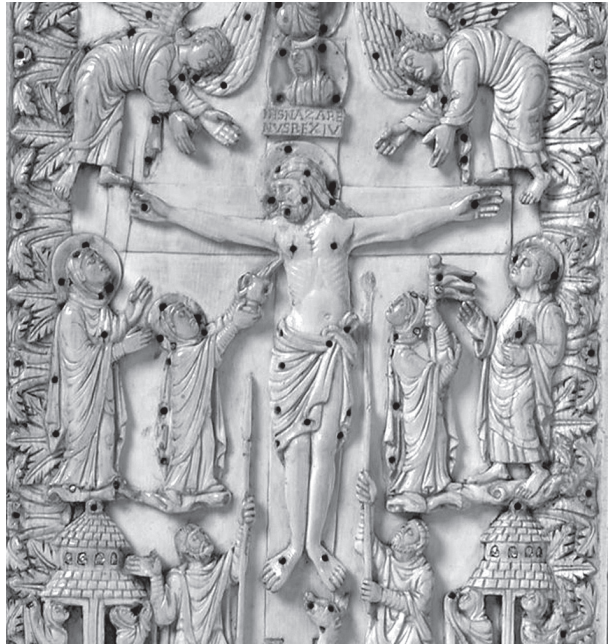
4. Bjelokosna korica rukopisa iz Metza, 9. st., Victoria i Albert muzej, London, detalj (Wikimedia Commons)

prikaz raspeća, kojemu se sada posvećuje cijela stranica. 14 Prikaz krvarećih Kristovih rana nije invencija zrelog srednjeg vijeka, on se pojavljuje u ranijem periodu i upućuje na dvojnost događaja: trijumf Božjega Sina i patnju inkarniranoga Boga, o čemu svjedočanstva postoje u nizu radova u bjelokosti ili iluminacija u rukopisima. Između ostalih, treba naglasiti i motiv skupljanja krvi iz rane na boku koji se pojavljuje već u 9. stoljeću u vidu personifikacije Crkve koja skuplja krv u kalež – kao na primjeru bjelokosti iz Berlina iz 9 st., Drogovu sakramentariju (Paris, BNL, MS lat. 9428, fol. 43v), bjelokosnim koricama evanđelistara Henrika II. koje datiraju u 9. st. (Bayerische Staatsbibliothek, München) 15 ili bjelokosnim koricama iz Metza iz druge polovice 9. stoljeća (sl. 4.) 16 i drugo.