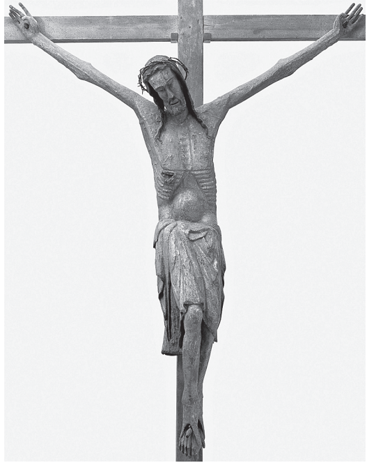
2. Drveno raspelo iz Rogova, 14. st.

kojima su građena ikonografska načela i svako nalaže zahtjevan pristup 'čitanju' prikaza. 12 Pritom je iznimno važan kontekst i djela i 'slike', koji nije nimalo jednostavan (kako se to može činiti), već otvara slojeve poruka i značenja koji se ne mogu svesti pod pravocrtni razvoj ikonografske tipologije. Tako poznajemo primjere koji odskaču od uobičajenih ikonografskih shema, poput stranice Sakramentarija iz opatije Gellone s kraja 8. stoljeća (sl. 3.), 13 koji na početnom slovu Te igitura pokazuje razapetog Krista, pobjednika, otvorenih očiju, ali s istaknutim ranama na rukama, nogama i boku iz kojih izbija krv – neuobičajen ekspresivni element za to vrijeme, koji upućuje na naglasak na tjelesnoj patnji i smrti na križu. Sagledan u povijesnom kontekstu, ovaj je prikaz dio cjeline (sakramentarija) koja je u nastojanjima Pipina Malog da stvori jedinstven liturgijski jezik povezala rimsku i galsku tradiciju u novome ritusu koji između Sanctusa i Te igitura uvodi pauzu materijaliziranu slikom Razapetog. Ta će promjena u molitvenoj praksi stvoriti prostor (najprije u rukopisima) za izdvojen i naglašen