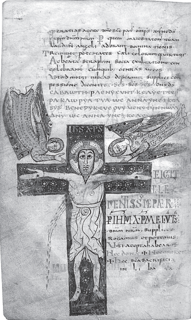
3. Stranica Sakramentarija iz opatije Gellone, cod. lat. 12048, fol. 143v, 8. st.