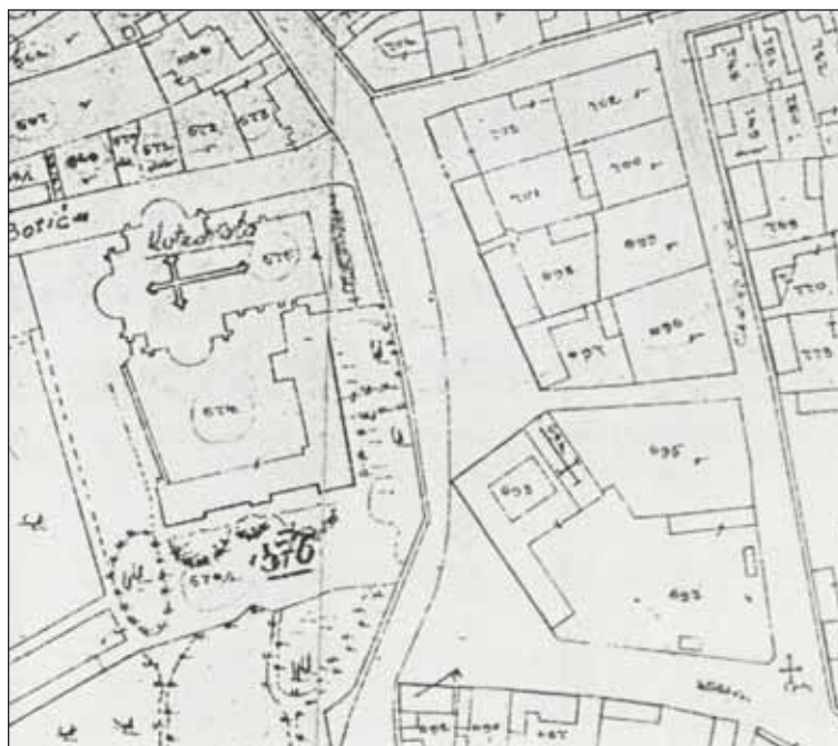
... i na planu iz 1902. godine.