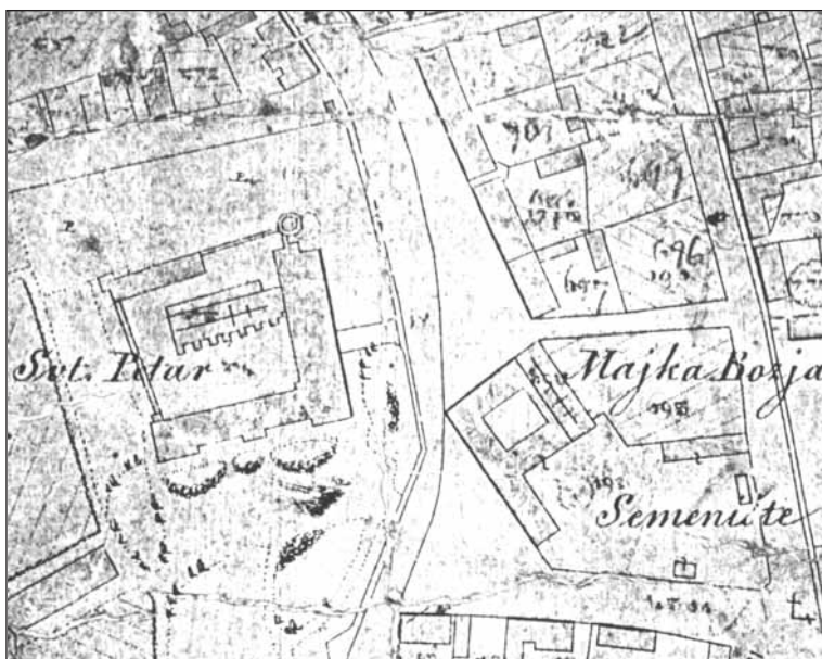
Trg i zgrade oko trga na planu načinjenom vjerojatno 1863. godine