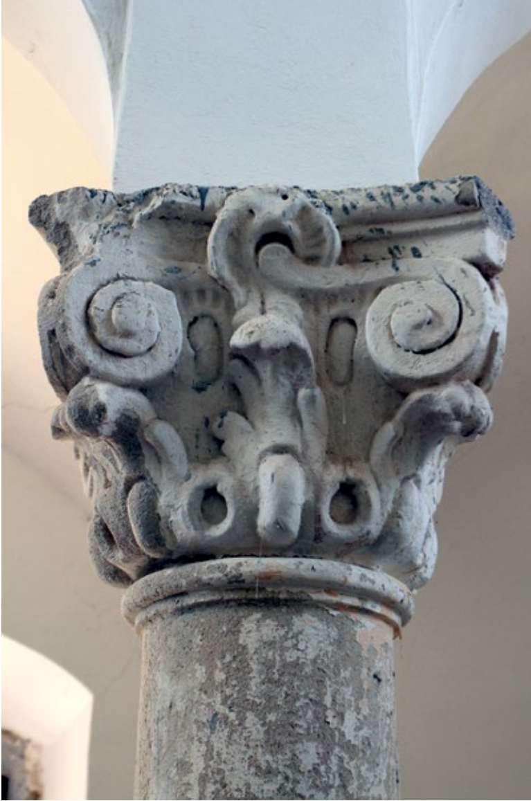
8 Kapela Majke Božje Lauretanske u Pogančecu, kapitel stupa pjevališta (Odsjek za arheologiju, Filozofski fakultet u Zagrebu)

Chapel of Our Lady of Loreto in Pogančec, choir loft column capital (Department of Archaeology, Faculty of Humanities and Social Sciences in Zagreb)