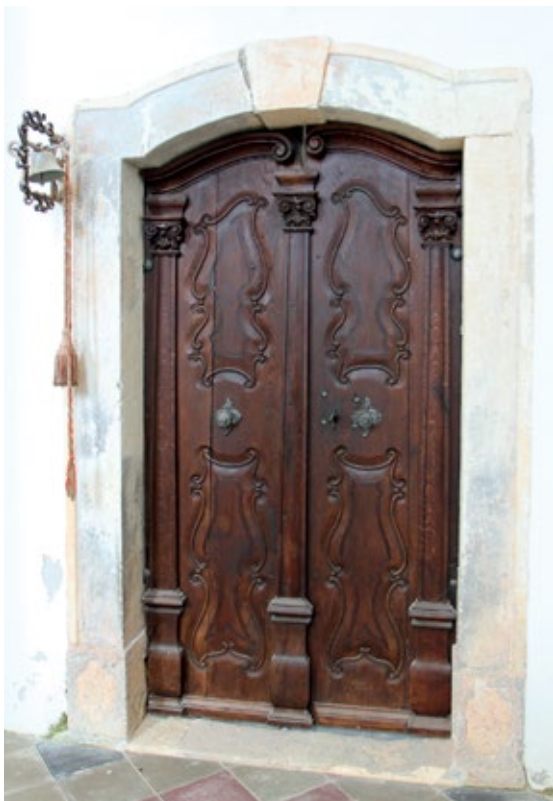
6 Kapela Majke Božje Lauretanske u Pogančecu, vrata sakristije

Chapel of Our Lady of Loreto in Pogančec, sacristy door