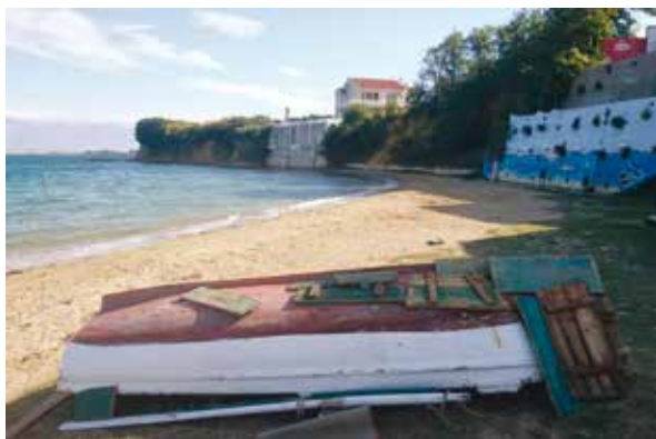
Slika 1: Privlaka, poluotok u stalnom zagrljaju mora Protej, morski bog, nakon smrti obojice sinova, Sokolara i Novaka, i svoje drage Prislavke, milujući je stalno, Privlaku uvijek drži zagrljenu rukama.

Žene su više puta dnevno išle na bunare i nosile vodu koja im je bila potrebna za piće, pranje i kuhanje. Sićem , limenom posudom za vodu, na koji je bio zavezan konopac dug više od desetak metara, grabile su vodu iz bunara i na svojim je glavama u kablovima nosile