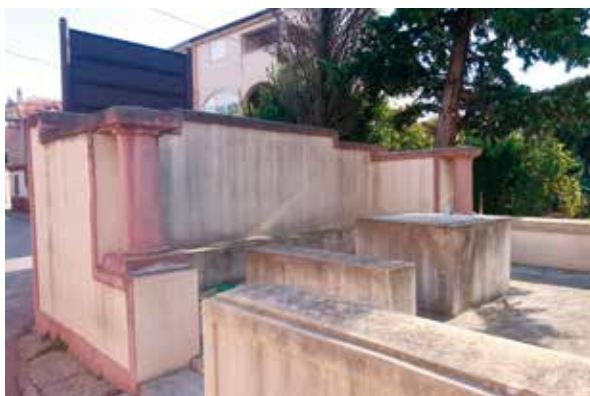
Slika 10: Bunar u Selu