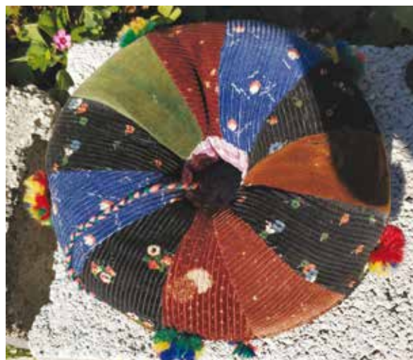
Slika 5: Spara, pomagalo koje je ženama omogućivalo lakše nošenje vode na glavi