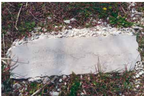
Slika 7: Stihovi Petra Zoranića iz Planina , uklesani u pločama razmještenim oko bunara „Sokolar“

zbog srdačne ljubavi koju u životu iskazivahu jedni drugima, Mare odvojkom svojega vrela, prošavši pod gorskim visinama i pod morskim dubinama i po tolikoj zemlji, često kreće da nađe svoga Novaka i, odjeljujući ogranak potoka, Dražniku za ljubav često donosi jelova lišća koje se stvori od Jelinih zlatovitih vlasi, kako su često mogli vidjeti oni koji tu žive. (Zoranić, 2000.)