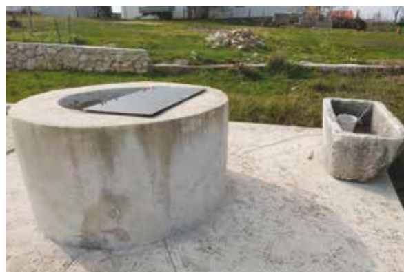
Slika 9: Bunar „Građenik“