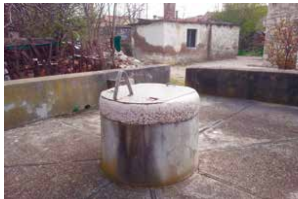
Slika 8: Bunar „Novak“

Onih koji pamte vrijeme kad je po vodu trebalo ići na bunare sve je manje. Bunari su tada bili izvori života, mjesto susreta, mjesto zaljublivanja, mjesto gdje su završili mnogi sićevi , prsteni, naušnice ili drugi predmeti koji su ispali nekom nespretnom korisniku/korisnici,