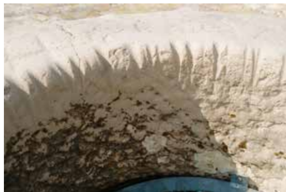
Slika 2: ... kad se voda izvlačila iz bunara, tragovi konopa u vijencu krune bunara

Svaki je zaselak želio imati svoj bunar. Ljudi su ih zajedno kopali i zajedno održavali. Šime Glavan opisao je u kronici „Glavani nekada i danas”, kako su 1909. godine kopali bunar u Glavana stanovima. Kopanje je bilo zanimljivo, posebno najmlađima, kako zbog uporabe eksploziva, za kojega su tada znali samo oni koji su bili u