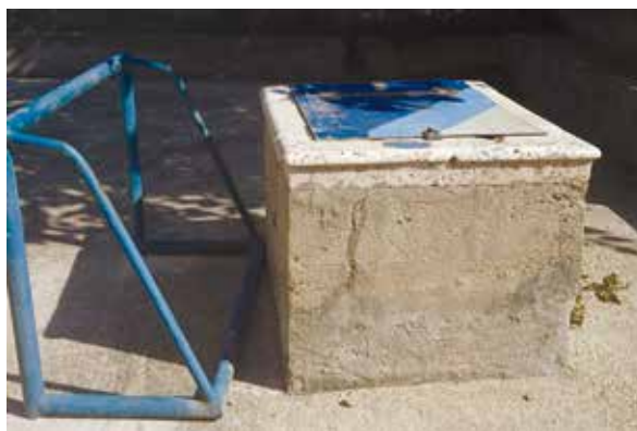
Slika 12: Bunari - mjesto susreta, nekada zbog vode koja život znači, a danas zbog najvažnije sporedne stvari na svijetu (čuveni nogometaš Josip Skoblar rodom je iz Privlake)

Ostaju priče dok su još živi stari ljudi kojima su značili život. Ostaju Zoranićeve Planine .