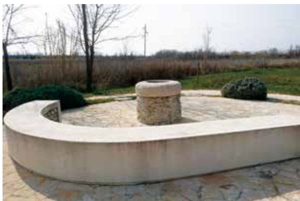
Slika 6: Bunar „Sokolar“