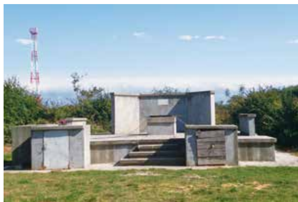
Slika 11: Put bunara vodi k bunaru koji se koristi i danas

mjesto uz koje su bili vezani i brojni običaji i priče. Na bunare se pazilo kao na oko u glavi, jer bez njih nije bilo života ni ljudima ni životinjama, ni vrtovima ni poljima ni vinogradima.