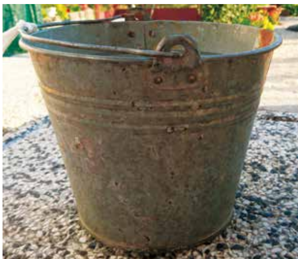
Slika 4: Sić, metalna posuda kojom se vadila voda iz bunara

Jeli i Mari, premda jednoj tijelo bijaše pretvoreno u drvo, a drugoj u vrelo, ipak svijest još osta netaknuta u prijetvorima. I premda one bijahu pretvorene gore na planinama, a Dražnik i Novak u donjem primorju, ipak