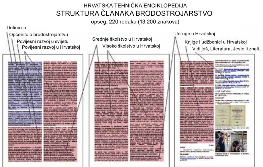
Slika 1. Struktura oglednoga članka HTE

Uz istaknute Hrvate i osobe hrvatskoga podrijetla obrađuju se i pripadnici drugih naroda rođeni na području današnje Hrvatske, bez obzira na to gdje su živjeli i djelovali, kao i stranci koji su živjeli i djelovali na ovome prostoru, osobe koje su zaokružile svoje životno djelo, ali i još uvijek djelatni suvremenici. Pri odabiru osoba Enciklopedija nastoji ne opteretiti se previše biografijama, pa su kriteriji za uvrštavanje razmjerno strogi, od rijetkih pojedinaca važnih za čovječanstvo u cjelini do osobito istaknutih, npr. fakultetskih profesora (akademici, professori emeritusi, redoviti članovi i emeritusi HATZ-a, dobitnici državnih nagrada za znanost, dekani velikih fakulteta, dugogodišnji urednici važnih časopisa). Ipak, i uz takve pretpostavke, HTE će ukupno obraditi oko 1500 osoba.