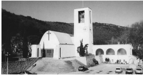
Crkva Sv. Barbare

Crkva Sv. Barbare u Raši ima oblik prevrnutog rudarskog vagoneta, a zvonik podsjeća na toranj izvoznog stroja.