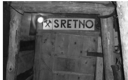
Rudarski pozdrav "Sretno"

Rudarenje je na Labinštini bilo od velikog značenja. Tijekom tog razdoblja nastala su mnoga gradska naselja, te većina današnjih tvornica, razvila se mnogobrojna infrastruktura (cestovna, vodovodna), školstvo, zdravstvo, ugostiteljstvo i turizam.