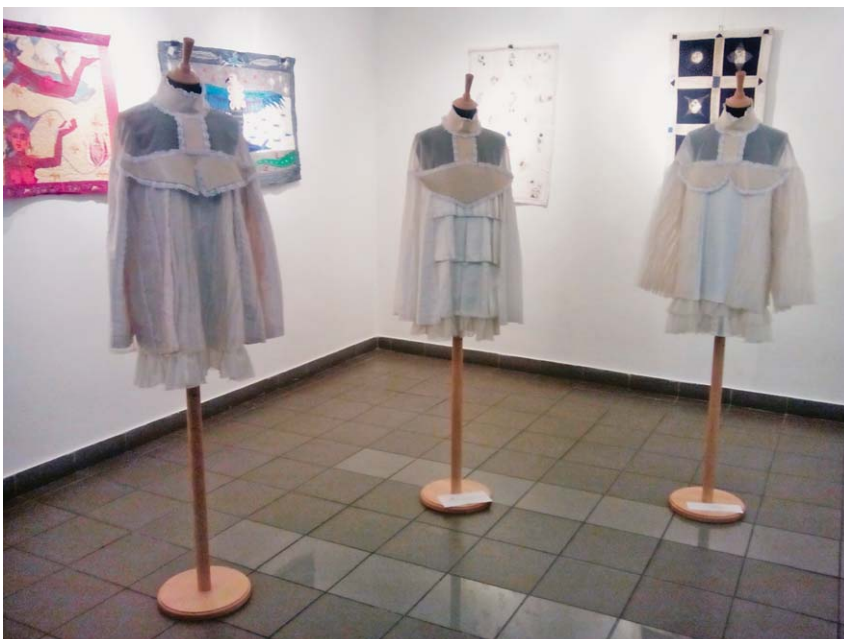
Sl.5 Izložba radova učenika Škole za modu i dizajn iz Zagreba

U okviru 11. znanstveno-stručnog savjetovanja Tekstilna znanost i gospodarstvo 2018. objavljen je i Zbor-