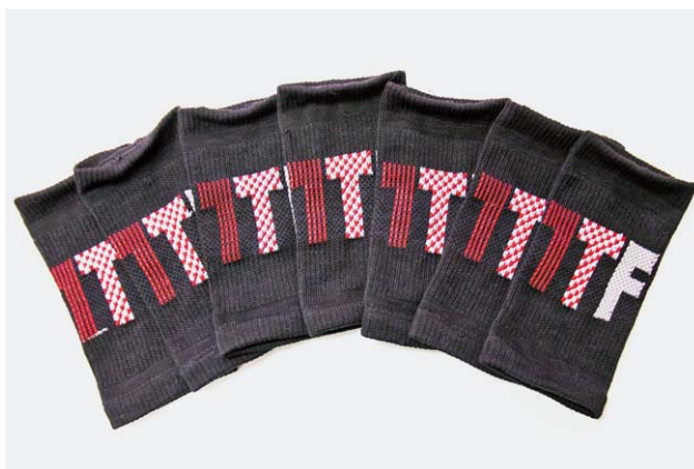
Sl.2 TZG 2018 - radionice: a) Od različitog tipa tijela do različitog tipa odijela , b) Izrada čarapa i termofiziološka svojstva plošnih proizvoda i obuće