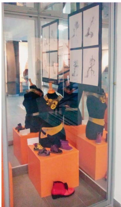
Sl.6 Izložba studentskih radova

nik radova u on-line izdanju s ukupno 36 radova koji su u okviru savjetovanja recenzirani i prezentirani u posterskoj sekciji, od kojih je 15 kategorizirano kao znanstveni radovi, 2 rada su pregledna i 19 stručnih radova. Plenarno predavanje i pet pozvanih predavanja prikazana su kao sažeci u Zborniku radova.