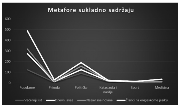
Slika 2.: Grafički prikaz podjele metafora sukladno sadržaju