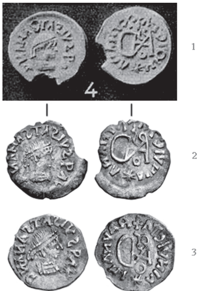
Sl. 4. - 1. Werner 1939, 90 Abb. 39:4. - 2. Gennari 2017, 122 br. 47. - 3. G&M 225/2014, br. 2821.

s lakoćom prepoznajemo kao čitljivu reversnu legendu \text{VIIIVICTA} \text{✝} \text{ΛROMΛI} \text{✱} (7 krakova) s reversnom oznakom \text{II} \text{✱} \text{V} . (Sl. 2:2). 14