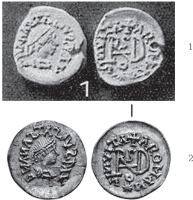
Sl. 1. - 1. Werner 1939, 90 Abb. 39:1. - 2. Savoca 8/2016, br. 629.

u Sirmijskoj Panoniji, nego u nekom drugom dijelu Teodorikova kraljevstva. Za sve tim srebrnjacima slične istočnogotske srebrnjake vjerovao je da su mogli biti povremeno kovani prema sličnom monetarnom obrascu bilo gdje u južnoj Francuskoj, sjevernoj Italiji ili na Balkanu. Za novce iz Mengena u konačnici je ipak zaključio, ostavši pri tome pomalo neodređen, tek to da potječu iz sjevernih provincija Teodorikova kraljevstva ( “aus den nördlichen Provinzen des Reiches Theoderichs stammen” ). 8