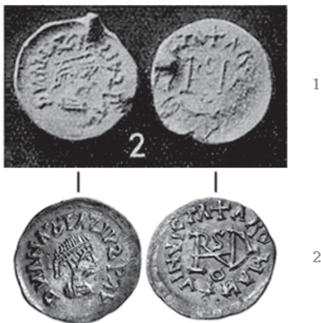
Sl. 2. - 1. Werner 1939, 90 Abb. 39:2. - 2. Jacquier 43/2017, br. 497.

sadržaji, njihove komponente i oblici kojima su prikazani na novcima iz mengenskog nalaza od izvorne su vrijednosti i važnosti pa njihova smislenost i čitljivost te izmjene ili odstupanja zahtijevaju da ih se istaknu, interpretiraju i eventualno protumače. Na četvrtsilikvama iz Mengena čitljivost legendi aversa i reversa može se prikazati trima kombinacijama: a) avers i revers čitljivi (3 kom.), 1-2A ; 7Ju I ; b) avers čitljiv, revers nečitljiv (3 kom.), 3-5A,-i ; c) avers i revers nečitljivi (1 kom.), 6A,i/i — napomene: brojevi 1-7 prema Werner 1933, Abb. 39; A - Anastazije; Ju I - Justin I; i - nečitljiv).