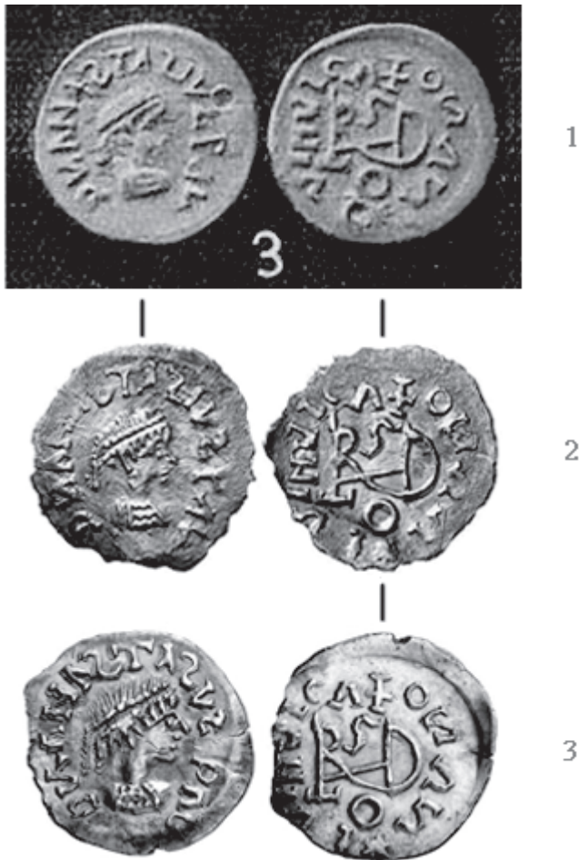
Sl. 3. - 1. Werner 1939, 90 Abb. 39:3. - 2. G&M 108/2001, br. 2179.

samo mengenski srebrnjak 2A . Upotreba reversnog kalupa novca 1A u kombinaciji sa srodnim ali ipak drukčijim aversnim kalupom potvrđeno je zasad samo na još jednom srebrnjaku "sirmijske" grupe (Sl. 1:2). 11