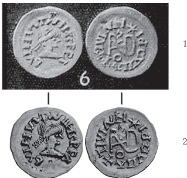
Sl. 6. - 1. Werner 1939, 90 Abb. 39:6. - 2. NAC 93/2016, br. 1232.

jednom primjerku novca istoga kalupa (Sl. 4:2). 19 S ovima, prvenstveno zbog slično koncipirane reversne legende i monograma u zrcalnoj slici, povezan je još jedan kalup "sirmijske" grupe (Sl. 4:3) 20 prema kojem su, čini se, oblikovane i pojedine imitativne serije "sirmijske" grupe. 21