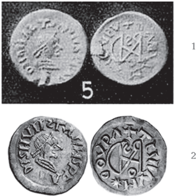
Sl. 5. - 1. Werner 1939, 90 Abb. 39:5. - 2. NAC 75/2013, br. 427.

"sirmijske" grupe prepoznatljive po ležećim slovima S na završetku reversne legende IJVINICA ✚ OΩΛΩ ✚ (6 krakova), nečitljive ponajviše u tom njezinom drugom dijelu. Nakon primjeraka iz Mengena ta aversno-reversna kombinacija ponovno je potvrđena tek 2001. godine na aukciji jedne poznate aukcijske firme u Münchenu (Sl. 3:2), 16 a nakon toga na raznim aukcijama ponuđeno je još desetak primjeraka istog kalupa slične ili bolje očuvanosti. Korištenje OΩΛΩ reversa potvrđeno je za još jedan aversni kalup koji prati ista aversna legenda ΔΙΑΝΑΖΤΑΖΙΒΡΑΥ, ali i drukčiji, nešto krupniji portretni prikaz, stilistički poprilično sličan onom prikazu na kalupu aversa kojim je kovan mengenski srebrnjak. (Sl. 3:3). 17