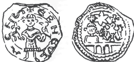
Slika 7. Srebrni denar frizaškog tipa vojvode Henrika Meranskog kovan u kovnici Otok (L 155, P 237, CNA Cj 25b)

Slično mišljenje može se uočiti u srednjovjekovnom tekstu Dancus rex , koji je nastao na normanskom sicilskom dvoru, a prema kojem bi vladar razumom i mudrošću, koje stekne strpljivim uzgojem divljih sokola, trebao osigurati svojim podložnicima red, pravdu i dostojan život. 26 U Europi je sokolarstvo stoljećima bilo privilegija plemstva, a u Hrvatskoj se pojavljuje već od 9. stoljeća. Na aversu frizaškog denara ( slika 7. ) vidi se stojeća osoba (vojvoda Henrik Meranski ili car) koja u desnoj ruci drži žezlo a u lijevoj sokola. Simbolika toga prikaza nije samo pokazati svoje lovačke sposobnosti, nego naglasiti svoju mudru i poštenu vladavinu. 27