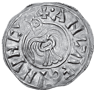
Slika 15. Avers anglo-vikinškog srebrnog pennya, Anlaf Guthfrithsson (939.-941.)

Godine 939., nakon smrti Aethelstana, Vikinzi su pod Anlafom Guthfrithssonom, okupirali York. Ta je okupacija trajala sve dok ih Eadred nije pobijedio 954. godine. Tijekom te okupacije Vikinzi su kovali nekoliko tipova kovanica u manje od 200 različitih varijanti, koje su danas vrlo rijetke. Postoje tri skupine kovanica koje su kovali: ona koja slijedi vrste suvremenog anglosaksonskog novca, vrste koje su bile kopije posebnih izdanja Anglosaksonaca ili ranijih vikinških izdanja, i tipova koji su bili novi, izvornog nordijskoga dizajna. Posljednja skupina, koja uključuje vrste „Raven“ - gavran i Triquetra - triketa, možda su najintrigantniji. Prema M. Blackburnu gavran tip kovanica ima jedan od najdramatičnijih dizajna u engleskoj seriji. 43 Ona prikazuje klasični simbol Vikinga, gavrana s ispruženim krilima i glavom okrenutom ulijevo. Budući da se gavran povezuje sa sv. Osvaldom (kraljevski svećenik Northumbrije), da triquetra predstavlja Trojstvo u umjetnosti 7.-8. stoljeća, a da je trokutasta zastava na kovanicama ukrašena križem, Blackburn spekulira da su dizajneri stvorili prikaz sup-tilno privlačan dvojnoj publici.