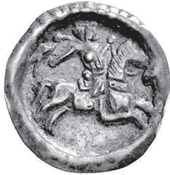
Slika 8. Srebrni brakteat, Bela IV. (1235.-1270.) Kralj jaše udesno sa sokolom u desnoj ruci. (Huszár 195)