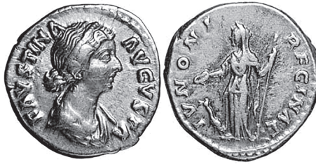
Slika 10. Srebrni denar Faustine Mlade (147.-176.). Na reversu Junona stoji okrenuta ulijevo, drži pateru u desnoj ruci, a u lijevoj dugačko žezlo. Paun gleda prema gore. RIC III Marko Aurelije 696.

Kršćani su preuzeli simbolizam pauna i počeli ga koristiti na svojim grobnicama u kontekstu kršćanske apoteoze, uzašašća posvećenih duša i njihovo sjedinjenje s Bogom. 33 Zbog pučkog vjerovanja da je paunovo meso neraspadivo, kršćanska je alegorija pauna uvrstila u simbole uskrsnuća i vječnoga života. U tom smislu sv. Augustin pita: „ Quis enim nisi Deus creator omnium dedit carni pavonis mortui ne putrescerent? ” „Tko je drugi osim Boga Stvoritelja svega podario puti mrtvoga pauna da istrune?“, ( De civitate Dei , XXI, 4, 1)