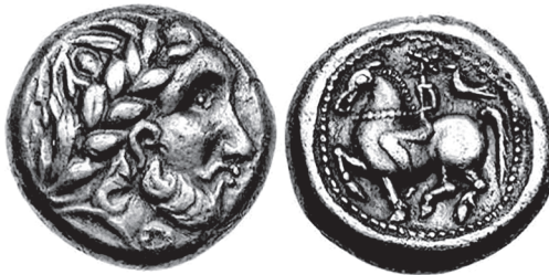
Slika 14. Kelti, Skordisci, 3.-2. st. pr. Kr., tip Filip II.

Na kovanicama željeznoga doba u Bretanji nalazi se gavran ili crna vrana na konjskim leđima; taj prikaz vjerojatno je odraz keltske tradicije poznate u Irskoj, a prema kojoj božica rata Badhbh poprima oblik gavrana ili vrane (Bird of Prey - ptica grabljivica), posebice u trenutku smrti ratnika. Sličan prikaz nalazi se na novcu Skordiska iz 3.-2. st. pr. Kr., na kojem je gavran (vrana) prikazan iza lijevog ramena konjanika i prati ga na putu u bitku. 41