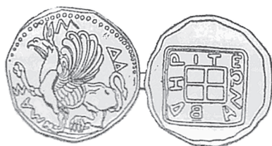
Slika 23. Kovanica grčkoga grada-države Abdere poznata kao „grifon tip“

Grifon, kojeg su Egipćani zvali „petbe“ - osvjetnik, nalazi se na kovanicama nome (nomos)* tipa grada Herakleopolisa. Njegovo pojavljivanje uz božanstvo na tim primjercima, za razliku od tradicionalnih primjeraka na kojima božanstvo drži Nike ili jabuke Hesperida, upućuje na to da je prikazano upravo božanstvo tog nomea. Bog na kovanicama Herakleopolisa vjerojatno je Eseph-Heraklo. 51