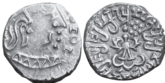
Slika 20. Srebrna dragma, Kumaragupta I, Indija, oko 415.-455. Na reversu: stilizirani Garuda stoji frontalno s raširenim krilima, iznad njega desno, sunce.