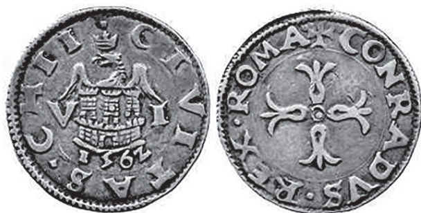
Slika 2. Srebrni groš, Maona, Vincenzo di Tommaso Giustiniani, 1562. Na aversu: grb grada Hiosa. Lunardi S48.

HIOS je grčki otok u istočnom dijelu Egejskog mora koji je u srednjem vijeku pripadao Bizantu, s prekidima do 1304. godine. Nakon toga dolazi pod vlast Genove. Talijani su bili više zainteresirani za profit nego za upravljanje otokom. Trgovina lokalnim bogatstvima bila je njihov primarni interes. Budući da su u odnosu na lokalno stanovništvo bili u manjini, često su imali poteškoća u naplati. Da bi tome doskočili, osnovali su, kao i u drugim mjestima, „maonu“, udruženje investitora zaduženih za upravljanje udjelima i ostvarenje prihoda ubiranjem poreza na određenom području. Udjeli su bili prodavani pojedinačno bogatim trgovcima, no ubiranje je bilo problematično, pa su se ti bogati trgovci udružili. Genova je zapravo prodala svoje pravo oporezivanja Hiosa maoni: „Maona di Chio e di Focea“ (1346.-1566.) koja je skupila sredstva od svojih investitora da bi kupila galije i pokorila ta mjesta.