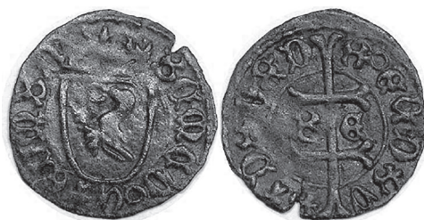
Slika 17. Denar Matije Korvina, 1446. kovan u Budi. Na aversu gavran unutar štita. Huszár 712.