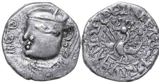
Slika 11. Srebrna drachma, Toramana - Indija, početak 6. stoljeća. Na reversu: stilizirani paun stoji raširenih krila. Göbl 119

Zbog svog šepurenja i navike da pokazuje ljepotu svoga perja, paun je postao i slika oholosti i svjetske taštine. Njegovo pero atribut je sv. Barbare, a odnosi se na Heliopolis, njezin zavičaj. Prema narodnoj predaji to je grad u kojem se pomlađuje ptica feniks. Budući da na Zapadu nisu poznavali feniksa, paun je postao znamen toga grada.