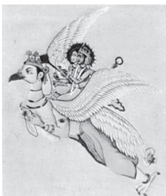
Slika 19. Višnu jaše Garuda

Garuda ( sanskrski garut= krila ) princ ptica u indijskoj mitologiji, ljubimac je Višnu koji jaše na njegovim leđima. On je solarna ptica i ubojica je zmija ili „naga“. Njegovo antropomorfnu tijelo zlatne je boje i ima orlovsku glavu, krila i kandže. 45