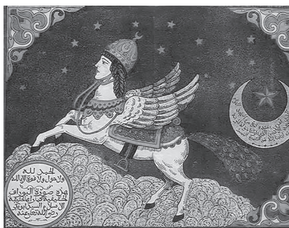
Slika 18. Prikaz buraka na Mogulskoj minijaturi iz 17. stoljeća

Garuda ( sanskrski garut= krila ) princ ptica u indijskoj mitologiji, ljubimac je Višnu koji jaše na njegovim leđima. On je solarna ptica i ubojica je zmija ili „naga“. Njegovo antropomorfnu tijelo zlatne je boje i ima orlovsku glavu, krila i kandže. 45