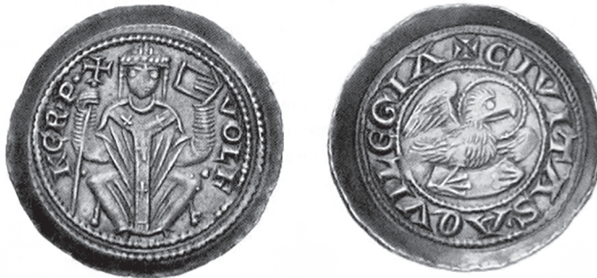
Slika 1. Srebrni denar patrijarha Volfkera (1204.-1217.). Na reversu: orao u pokretu udesno s aureolom oko glave. Oko orla legenda: CIVITAS AQVILEGIA - grad Akvileja.

Akvileja ( lat. Aquileia, sloven. Oglej) kojoj ime dolazi od Aquila - orao, naselje je na rijeci Natisone, osnovano 181. pr. Kr. kao rimska vojna kolonija, kojoj je cilj bilo osiguranje sjeverne Italije od Kelta. Grb je grada orao raširenih krila, često prikazan na kovanicama toga grada.