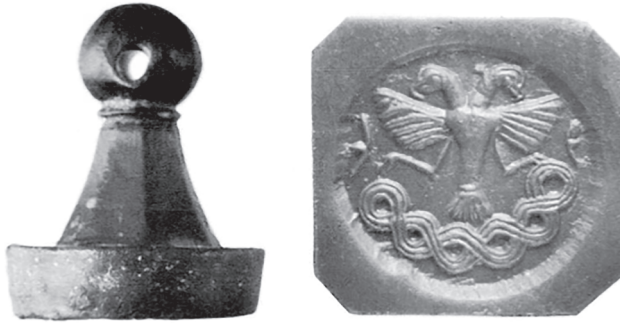
Slika 3. Dvoglavi orao na pečatu asirske trgovačke kolonije Hattuša (Hattusha)

bio je dvoglavi orao s plijenom u svojim pandžama. 12 Njegova pojava na pečatima Hetita mogla bi simbolizirati zaštitu nositelja pečata. 13