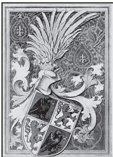
Slika 16. Grb Matije Korvina