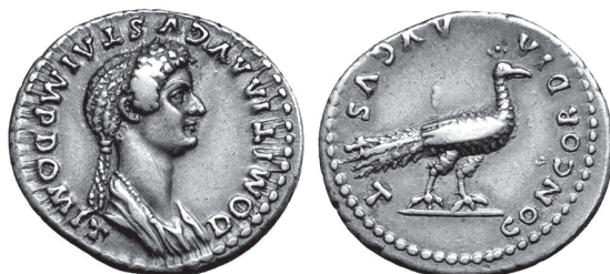
Slika 9. Srebrni denar Domicije Auguste (81.-84.). Na reversu paun stoji okrenut desno. RIC 151

Zbog tih razloga, s Junonom su se identificirale pojedine rimske carice, tako i Domicija Augusta (81.-84.), pa se na njezinu denaru ( slika 9. ) na reversu vidi paun, atribut božice Junone.