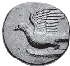
Slika 12. Avers brončanog dichalkona, Sikyonia (Sikyon) oko 330.-310./305. pr. Kr. Golubica leti ulijevo. HGC 5, 257.

Golubica je i prije judeokršćanske simboličke primjene bila poznat simbol sa širim značenjem čistoće, nježnosti i vjerne ljubavi. Zato je u prikazima i opisima bila vezana uz „božice ljubavi“: feničku Aštartu, grčku Afroditu i rimsku Veneru. 35