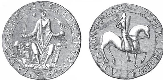
Slika 13. Veliki pečat engleskoga kralja Stjepana (1135.-1154.).

Golub se vidi na prednjoj strani Velikog pečata engleskih kraljeva Henrika I. (1100.-1135.) i Stjepana (1135.-1154.). 39 Okrunjeni kralj sjedi na visokom ukrašenom prijestolju. Odjeven u svoje državničke halje u desnoj ruci drži mač, a u lijevoj ruci drži kraljevsku kuglu, s križem na kojem stoji golub.