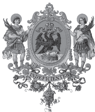
Slika 5. Povijesni grb grada Rijeke

Na zahtjev Riječana car Leopold I. izdao je povelju 6. lipnja 1659. kojom gradu Rijeci odobrava grb. Taj grb ima zanimljiv prikaz dvoglavog orla gdje obje glave orla gledaju na istu stranu, čime ostavljaju dojam da su prikazana dva orla, a ne jedan orao. Orao desnom kandžom stoji na stijeni, a lijevom drži vrč iz kojega teče voda. Iznad orla nalazi se kruna, a ispod njega natpis INDEFICIENTER (nepresušan).