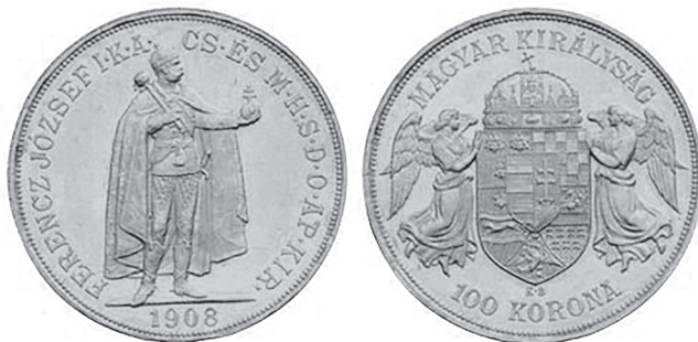
Slika 6. Zlatnik - 100 kruna iz 1908. godine s grbom Rijeke

se i na zlatnim novcima krunskog sustava, i to samo na onima na kojima je mađarski grb. Dvoglavi orao nalazi se u tzv. sfernom trokutu pri dnu grba, a ti novci kovani su u kremničkoj kovnici s oznakom KB (Körmöczbánya - Kremnitz). 18