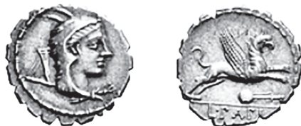
Slika 24. Srebrni denar L. Papiusa. Na reversu grifon koji skače preko amfore udesno. Sydenham 773.

Budući da je lav tradicionalno bio kralj zvijeri, a orao kralj ptica od srednjeg vijeka, grifon je smatran osobito moćnim i veličanstvenim bićem. U simbolici se upotrebljava u