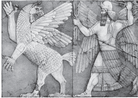
Slika 21. Ninurta proganja Imduguda iz Enlilova svetišta (Austen Henry Layard, Spomenici Ninive, 2. serije, 1853.)

U akadskoj predaji Zu se zove Imdugud koji je polu-demonско, polu-božansko biće i kao zlokobna moć prijeti domaćim životinjama. U svom drugom aspektu ono je atribut boga Ningirsua koji je vjerojatno identičan s mezopotamskim božanstvom Ninurtom. 47