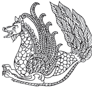
Slika 22. Senmurw

Senmurw je mitsko krilato čudovište u drevnom Iranu. U tradiciji je opisano kao šišmiš koji kombinira prirodu psa, ptice i muflona. U sasanidskoj umjetnosti zastupa ga neka vrsta pauna-zmaja s glavom psa. Fantazije koje se odnose na Senmurwa kasnije su prebačene u suvremenu iransku čudotvornu pticu Simurgh, koja je toliko stara da je vidjela uništavanje svijeta već tri puta. 48