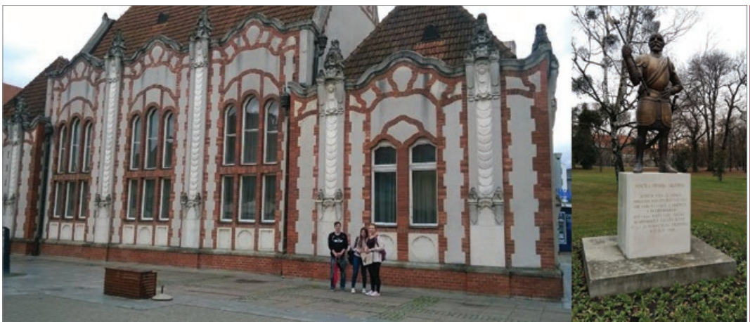
Sl.1a i 1b Terenski rad učenika: popisivanje i fotografiranje kulturno-povijesnih spomenika grada Čakovca

središta Čakovca označavali znamenitosti koje su pronašli i objasnili njihovu važnost. U radu je korišten smart notebook program. To je interak-