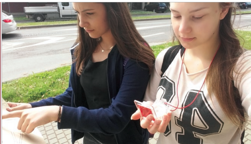
Sl. 3. Orijentacija pomoću kompasa i karte

Sljedećih nekoliko sati radilo se u učionici. Dio učenika je radio na osmišljavanju zadataka uz uputu za kretanje, a dio učenika je izrađivao plan središta Čakovca. Učenici su pokušali sastaviti uputu za kretanje na što kreativniji način. Naš plan središta Čakovca izrađen je na osnovu