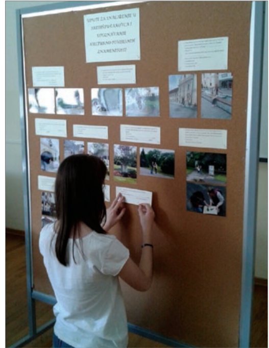
Sl. 5. Pripremanje izložbe za Dan škole

Povodom Dana škole te Dana otvorenih vrata krajem nastavne godine učenici su, da bi pokazali posjetiteljima što su radili tijekom nastavne godine, pripremili tematsku izložbu i prezentaciju. Na panoima u učionici geografije, pomoću fotografija i tekstova, prikazan je tijek rada te završna uputa za kretanje središtem grada i plan Čakovca.