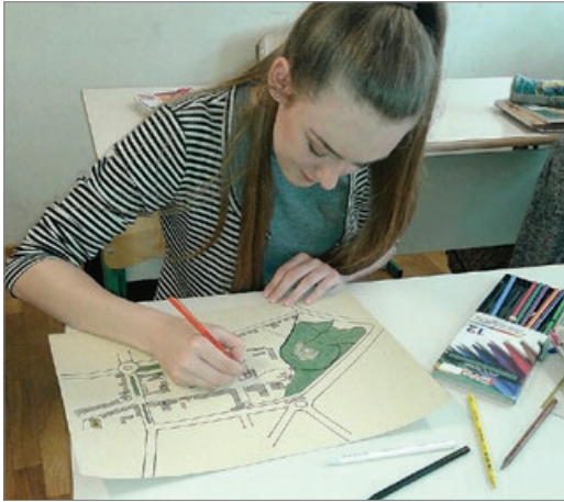
Sl. 4. Izrada plana središta grada Čakovca

plana grada Čakovca. Učenici su napravili svoj plan u odgovarajućem krupnijem mjerilu, ucrtali zgrade, prometnice i zadane orijentire. Time su razvijali svoju kartografsku pismenost i geografske vještine. Ujedno su upoznali kulturno-povijesne znamenitosti svoga grada kraj kojih su svakodnevno prolazili, a neke nisu ni zamijetili.