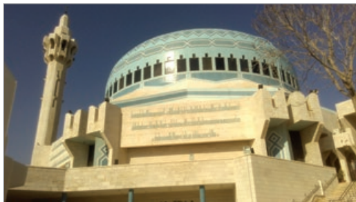
Sl. 1. Džamija kralja Abdulaha I, Amman

Najveće znamenitosti Ammana su ostaci antičke citadele s Herkulovim hramom, Arheološki muzej i očuvani rimski amfiteatar. U gradu se nalazi i prekrasna džamija kralja Abdulaha I izgrađena 80-tih godina 20. stoljeća (sl. 1). Prepoznatljiva je po plavom mozaiku na kupoli. Ženama nije dozvoljen ulazak u džamiju, osim kao turistkinjama, a u tom slučaju oblače posebnu haljinu s pokrivalom za glavu. Skidanje obuće obavezno je prije ulaska. U džamiju može ući i do 7000 ljudi. Danas služi uglavnom u turističke svrhe i u njoj se nalazi galerija.