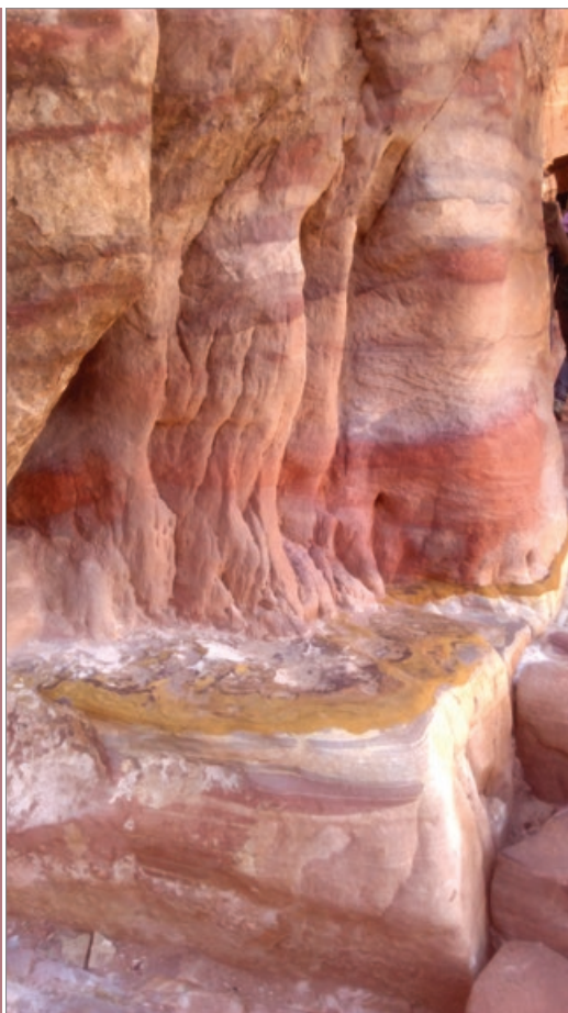
Sl. 8. Petra