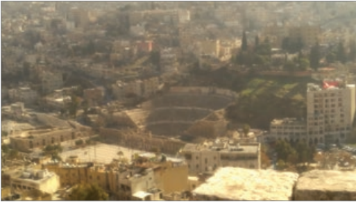
Sl. 3. Rimski amfiteatar, Amman

Ije očuvan rimski grad nekadašnjeg Dekapolisa, te najspektakularniji rimski grad na Bliskom istoku, ali i izvan Italije. Grad je izgrađen prije oko 2000 godina, a arheološka iskapanja su počela 1920. godine te je od tada pronađeno oko 22 tisuće iskopina. Jerash je originalno nastao u grčko doba, te su hramovi bili posvećeni grčkim bogovima. Grčke bogove kasnije su zamijenili rimski, a rimske je bogove zamijenio kršćanski. Muslimani su u grad došli u 7. stoljeću. Godine 749. potres je razorio Jerash.