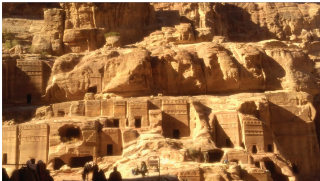
Sl. 7. Kraljevske grobnice, Petra

grobnica jedna do druge (sl. 7). Razaznaju se nabatejski, grčki i rimski utjecaji. Na izlasku s područja nekadašnjeg grada, nalazi se možda najljepši spomenik ove izgubljene kulture, El-Deir. U prijevodu, ovo ime znači „samostan“, vjerojatno zato jer su u srednjem vijeku ovdje obitavali redovnici. Nije skriven, leži visoko na brijegu i impresivan je ne samo zbog svoje veličine. Urna na vrhu ukrasnog okruglog hrama nad ulazom visoka je 9 metara. Zbog njegovog jednostavnog ali monumentalnog stila, Ed-Deir se smatra jednim od vrhunaca nabatejske kulture. Ljepotu cijelog lokaliteta nemoguće je opisati riječima, već je treba doživjeti (sl. 8).