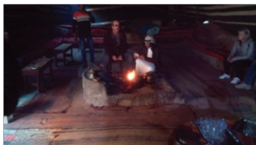
Sl.11. Beduinski šator, pustinja Wadi Rum