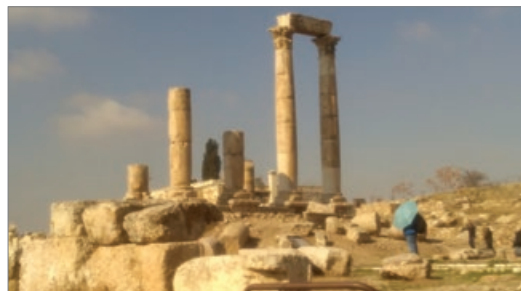
Sl. 4. Škola mozaika, Madaba

Drugo jutro napuštamo glavni grad i odlazimo prema Madabi, planini Nebo, Keraku i Petri. Čeka nas cjelodnevno putovanje, ali isplati se obzirom na viđeno. Madaba se smjestila 30 kilometara jugozapadno od glavnog grada. Poznata je po bizantskim i omejidskim mozaicima te grčkoj pravoslavnoj crkvi svetog Jurja, gdje se može vidjeti najstarija sačuvana originalna karta Svete Zemlje iz 560. godine. Karta je napravljena kao mozaik, a sastoji se od gotovo 2 milijuna dijelova. Osim samog Jeruzalema na karti je prikazano cijelo područje današnjeg Izraela i Jordana pa je tako vidljiva i ondašnja veličina Mrtvog mora koje nije bilo razdvojeno u dva bazena. U Madabi je 2008. izgrađena Isusova džamija. Smještena je kraj crkve, a na njezinim zidovima ispisani su citati iz Ku'rana u kojima se spominju Isus i Majka Božja. Za izgradnju džamije bilo je potrebno otkupiti zemlju od kršćanina, koji je novac od prodaje darovao u dobrotvorne svrhe. Njemu u čast džamija je nazvana Isusova džamija. U Madabi se nalazi i srednja škola za izradu i restauraciju mozaika, osnovana od strane talijanske vlade (sl. 4). Bizantski mozaici jedna su od glavnih atrakcija za turiste. Izrađuju se na dva načina: stari i novi i možete prisustvovati izradi. Cijene mozaika