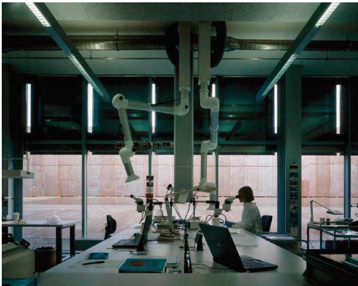
Slika 3. Centar zbirki u Affolternu na Albisu – laboratorij.

hrane zbirki. Posebna pozornost bila je posvećena organizaciji prostora, tehničkim zahtjevima i održivosti. Tri paralelna objekta međusobno su povezana širokim bočnim prolazom koji nije prethodno postojao, a njegove su glavne funkcije uspostava komunikacijskog kanala među objektima te zaštita. Najveći od tri objekta sadržava oko 10 000 m 2 prostora i služi kao prostor za smještaj svih predmeta, dakle kao ključno i središnje mjesto Centra zbirki. U drugom objektu, koji se nalazi u sredini i povezan je izravno s čuvaonicom, nalaze se konzervatorsko-restauratorske radionice te laboratorij za konzervatorska istraživanja i analizu materijala. Treći objekt je glavni korisnički prostor s glavnom recepcijom,