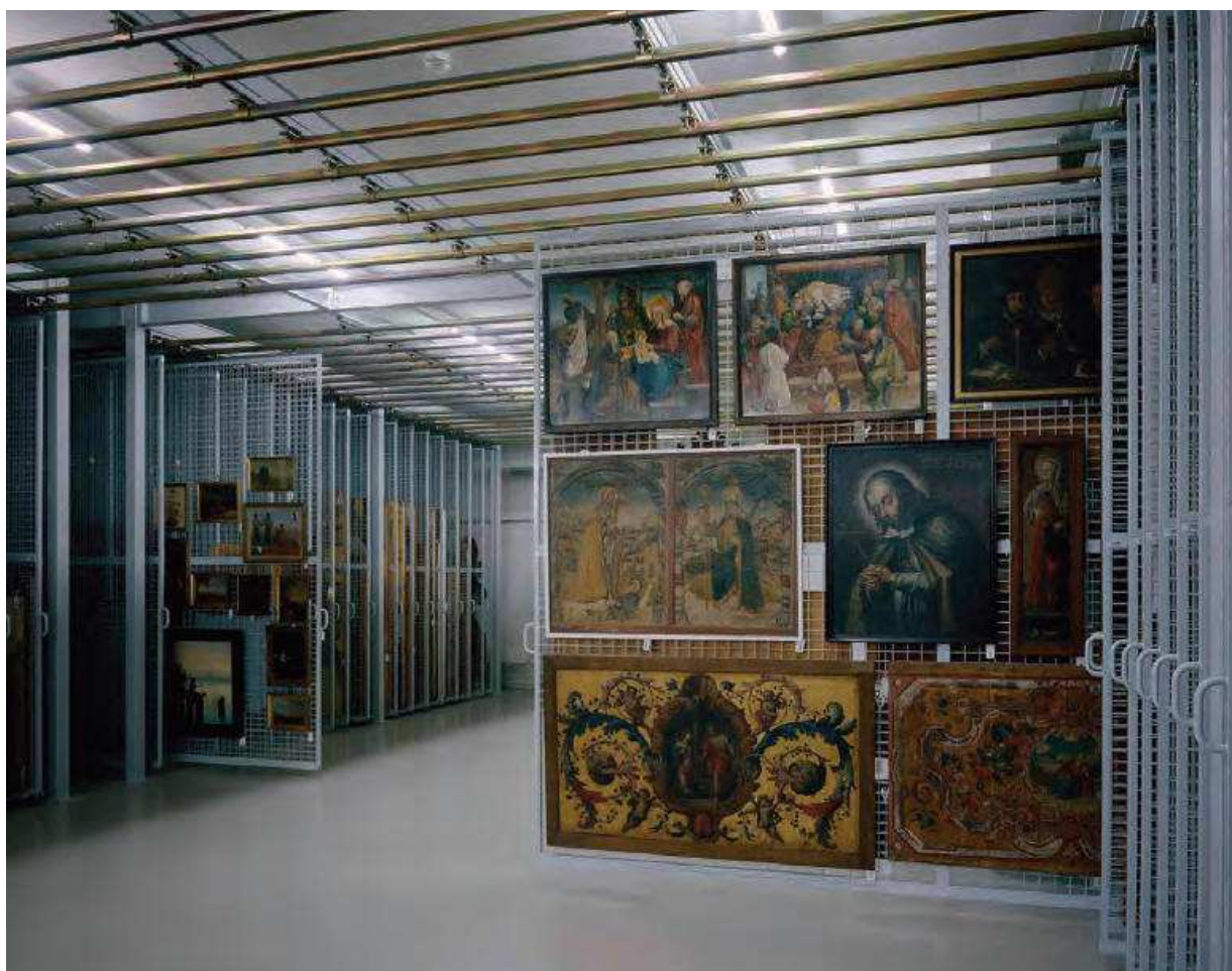
Slika 4. Centar zbirki u Affolternu na Albisu – dio čuvaonice.

koordinacija poslova pakiranja na lokacijama postojećih čuvaonica u odnosu na prihvata i smještaj u novom prostoru. Kako bi se osiguralo da u samom procesu ništa ne bude izgubljeno, svaka transportna kutija (ili veći predmet) imala je svoj poseban broj i crtični kod u koji je bilo precizno upisano krajnje odredište predmeta do položaja na polici, a dokumentacija o izlasku, praćenju predmeta tijekom transporta te prihvatu na novoj lokaciji bilježila se u, za tu priliku, posebno oblikovanoj bazi podataka. Sve kutije bile su opremljene i fotografskim prikazom sadržaja kako bi osoblju bilo lakše identificirati predmete. Kako bi se uštedjelo vrijeme i novac, svi predmeti su fotografirani i digitalizirani, a podatci