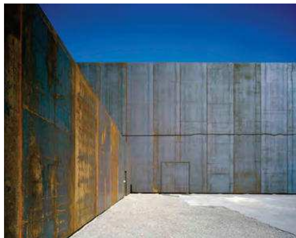
Slika 2. Centar zbirke u Affolternu na Albisu – dio pročelja.

kustoskih soba, restauratorskih radionica i sl., jedna od najčešćih boljki muzeja, pogotovo onih smještenih u povijesnim građevinama. Isti problemi prepoznati su i kod navedenih triju švicarskih muzeja koji sada djeluju pod istim krovom Nacionalnog muzeja. Tijekom samog osnutka Nacionalnog muzeja u Zürichu 1891. godine u namjenski sagrađenoj zgradi bilo je dovoljno mjesta za smještaj svih zbirki i predmeta, stalni postav, sobe kustosa, čak i umjetničku školu. No, kako je ipak riječ o nacionalnome muzeju, povećanje broja predmeta tijekom godina naglo je raslo te je prva rasprava o nužnom proširenju zgrade Muzeja zabilježena već 1933. godine, a ostale su slijedile gotovo svakih deset godina 5 tijekom 20. stoljeća. U međuvremenu prostora je bilo sve manje, što je nužno dovelo do premještanja umjetničke škole na novu lokaciju, a potom i prvo do preseljenja dijela zbirke iz tjesne čuvaonice na novu lokaciju u gradu. Do kraja prošlog stoljeća ovaj ciriški muzej raspolagao je sa sedam različitih čuvaonica razmještenih svuda po gradu. Ovakva situacija bila je daleko od