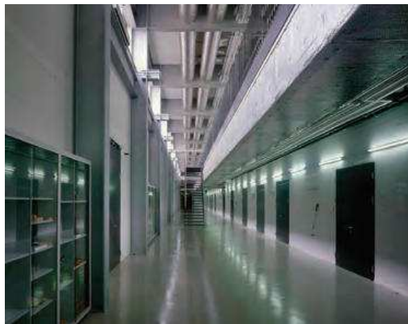
Slika 5. Centar zbirki u Affolternu na Albisu – glavni hodnik.

iskorišteni u privremenoj bazi podataka poslije su postali temelj za konačnu i službenu bazu podataka Centra. Cijela organizacija posla podsjećala je na dobru praksu dostave paketa i pošiljki, s crtičnim kodovima i brojevima za praćenje, što je postao standard u današnje doba. Osim same zaštite i pohrane predmeta glavna aktivnost Centra je potpora izlož-