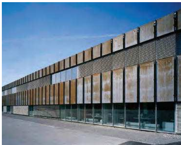
Slika 1. Centar zbirke u Affolternu na Albisu – pogled na pročelje unutrašnjeg dvorišta.