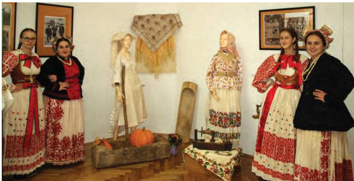
Slika 7. Dio etnografske baštine Dubrovčaka na izložbi u Muzeju Ivanić-Grada, 2016.