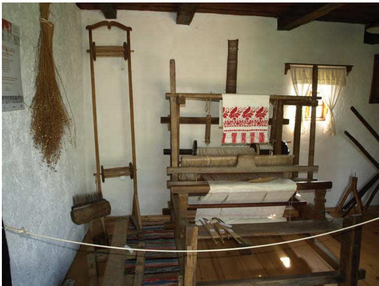
Slika 4. Tradicijski čardak i etnozbirka nejasne budućnosti, 2017.

trenutačnoga muzejskog središta. Riječ je o kući Kundek, zaštićenoj, povijesno i ambijentalno vrijednoj građevini koja pomalo propada već gotovo trideset godina.