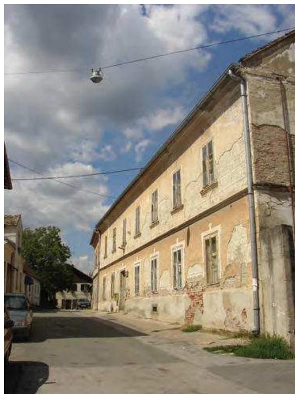
Slika 3. Zaštićena kuća Kundek u povijesnoj jezgri grada, 2006.

Prostorni kapaciteti muzejskog središta svedeni su na oko 80 m 2 izložbenog prostora (dvije veće prostorije i hodnik, s mogućnošću kružnog obilaska), mali