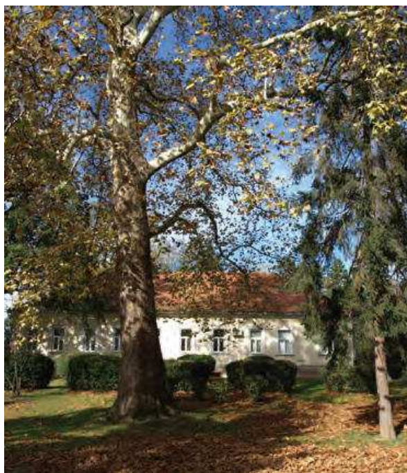
Slika 1. Muzej Ivanić-Grada u gradskom parku, 2017.

Slojevita baština Ivanić-Grada, koja se stvarala tijekom stoljeća zanimljive povijesti ovoga gradića na jugoistočnom dijelu teritorija današnje Zagrebačke županije, nedvojbeno je izazov za muzeologa. Izostanak sustavnih arheoloških istraživanja u povijesnoj jezgri i na širem području grada, nedovoljno definirana najstarija povijest koju dijele današnja naselja Ivanić-Grad i susjedni Kloštar-Iva-