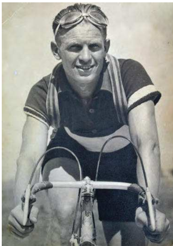
Slika 5. Iz obiteljske zbirke Grgac – s izložbe u Muzeju Ivanić-Grada, 2016.

U tom smislu Muzej djeluje obrazovno i savjetodavno na terenu, pomažući vlasnicima vrijedne nepokretne ili pokretne baštine te potencijalne muzejske građe u cilju što kvalitetnijeg čuvanja, zaštite, obnove, evidentiranja i dokumentiranja povjerene im baštine, a potiče i oblikovanje obiteljskih zbirki te njihovu profesionalnu registraciju. Sa zainteresiranim vlasnicima Muzej sklapa ugovore o posudbama i donacijama te pokušava pomoći u pronalaženju obostrano prihvatljivih i, u konkretnom slučaju, najpovoljnijih uvjeta za stručno čuvanje te povremeno javno predstavljanje baštine.