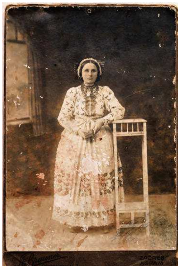
Slika 6. Dio etnografske baštine Dubrovčaka na izložbi u Muzeju Ivanić-Grada, 2016.

vijesna zbirka Dubrovčaka Lijevog, naravno, uz stručnu pomoć i koordinaciju Konzervatorskog odjela, Muzeja Ivanić-Grada i Državnog arhiva u Sisku.