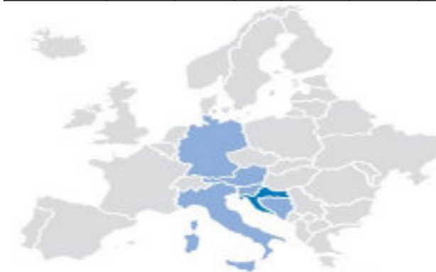
Slika 4. Najvažnija tržišta proizvođača proizvoda od kože

Kožarsko-prerađivačka industrija radno je intenzivna i izrazito izvozno usmjerena na tržište Europske unije i BiH, kamo se izvozi najveći dio proizvodnje (sl. 4).