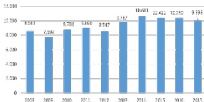
Slika 1. Broj zaposlenih i plaće za djelatnost C15

U tablici 1 je prikazan broj zaposlenih u proizvodnji kože i srodnih proizvoda u djelatnostima C15.1 i C15.2