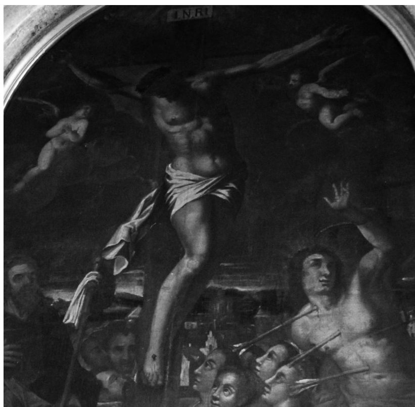
Raspeće na pali u Korčuli, detalj