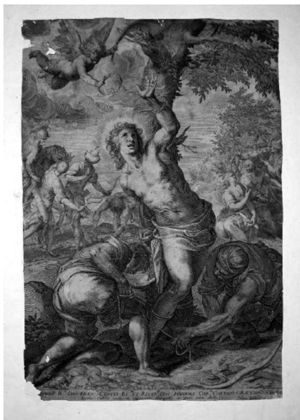
Sedeler Aegidius II, Mučenje sv. Sebastijana – prema Jacopu Palmi Mladem, Menaggio, Villa Mylius-Vigoni